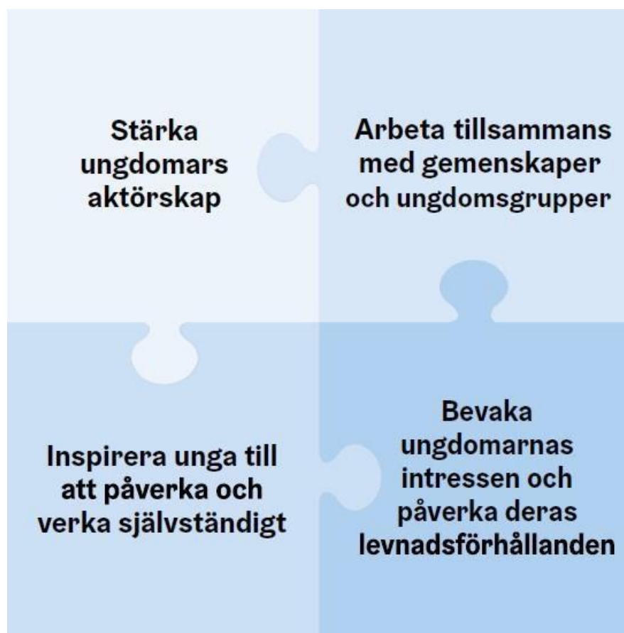
Bild 4. Ungdomstjänsternas fyra arbetsformer. De fyra pusselbitarna på bilden illustrerar hur ungdomstjänsternas arbetsformer överlappar och kompletterar varandra. Dessa fyra arbetsformer är: Stärka ungdomars aktörskap. Arbeta tillsammans med gemenskaper och ungdomsgrupper. Inspirera unga till att påverka och verka självständigt. Bevaka ungdomarnas intressen och påverka deras levnadsförhållanden.