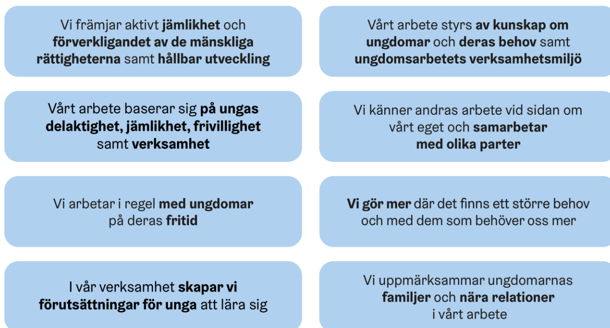
Bild 3. Principer som styr vårt arbete

Inom NUPS-processen definierades åtta principer, som styr allt vårt arbete.