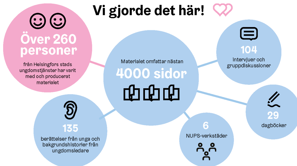
Bild 1: Sara Honkanen/Helsingfors stad, 2020. I illustrationen visualiseras den grundläggande planen för ungdomsarbete med hjälp av antalet personer som deltagit i utarbetandet av det (över 260 personer), omfattningen av materialet som använts för det (nästan 4 000 sidor), antalet intervjuer och gruppdiskussioner (104), antalet dagböcker (29), antalet berättelser från unga och bakgrundsberättelser från ungdomsledare (135) och antalet NUPS-verkstäder (6).