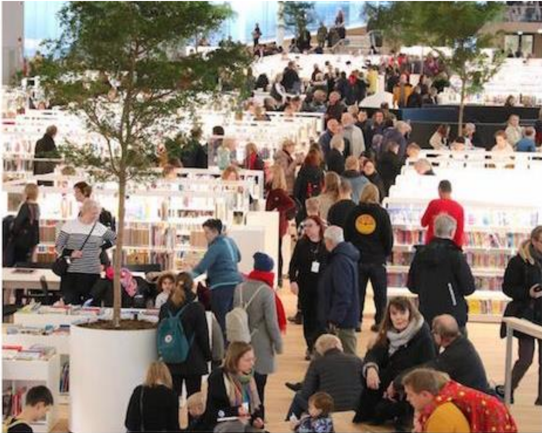
Tavallinen lauantai 2019