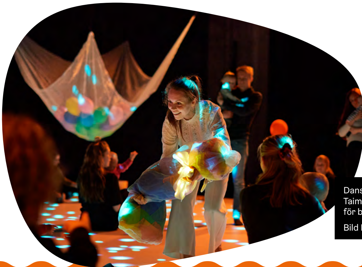
Dansens Hus evenemang Taimisto (Plantgården) för barn födda 2022

Helsingfors förändras och mångfalden ökar hela tiden. I Kulturens fadderbarn möter konst-, kultur- och idrottsaktörer alla slags barnfamiljer i Helsingfors och får på så sätt en möjlighet att förstå och nå fram till framtidens publik. Det hjälper aktörerna att utveckla och planera sin egen verksamhet så att de är relevanta också för framtidens helsingforsare.