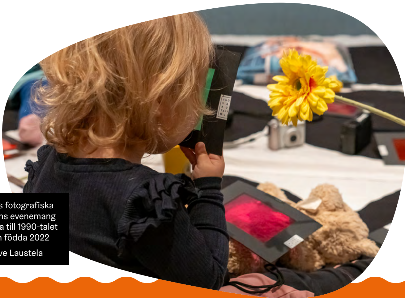
Finlands fotografiska museums evenemang Tidsresa till 1990-talet för barn födda 2022

På Jane och Aatos Erkkos stiftelse ser vi ett värde i aktiviteter som sammanför ett bredare spektrum av aktörer, främjar skaparnas färdigheter och möjliggör nya, till och med spridbara handlingsmodeller. Kulturens fadderbarn verksamheten handlar om att våga tänka stort och djärvt, att ge sig ut på en resa och lära sig av framgångar och misstag. Vi önskar många lyckliga möten och nya upplevelser för både aktörer och mottagare. Låt oss tillsammans ta hand om våra barns framtid - som en modern by!