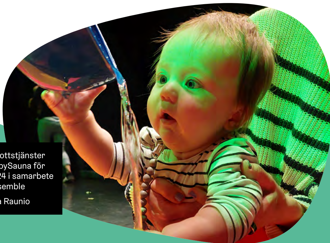
Helsingfors idrottstjänster evenemang BabySauna för barn födda 2024 i samarbete med Loiske ensemble

Förutom fadderaktörerna ska man även komma ihåg de andra samarbetsparterna, såsom rådgivningsbyråer och småbarnspedagogiken. Dessutom är det viktigt att gemensamt identifiera barnens fortsatta väg inom fritidssysselsättningar och skapa vägar framåt.