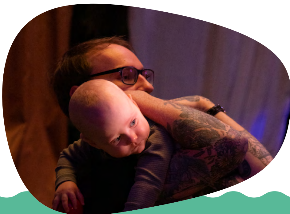
Dansteater Hurjaruuths evenemang Hupsistupsis! – Cirkusverkstad för barn födda 2022