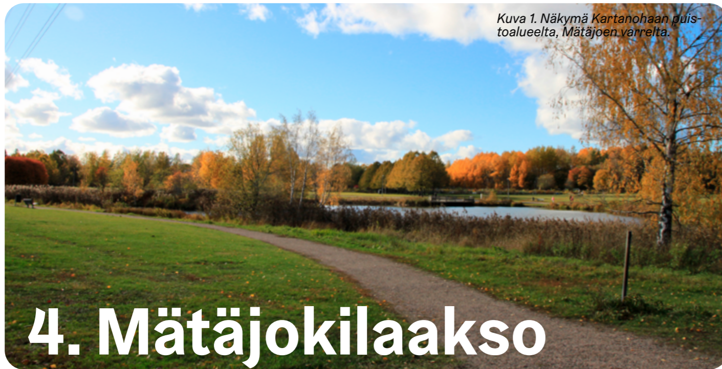
Kuva 1. Näkymä Kartanohaahan puistoalueelta, Mätäjoen varrelta.