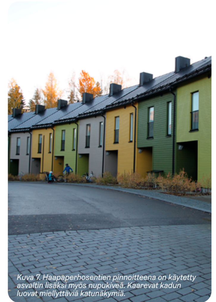
Kuva 7. Haapaperhosentien pinnoitteena on käytetty asfaltin lisäksi myös nupukiveä. Kaarevat kadun luovat miellyttäviä katunäkymiä.