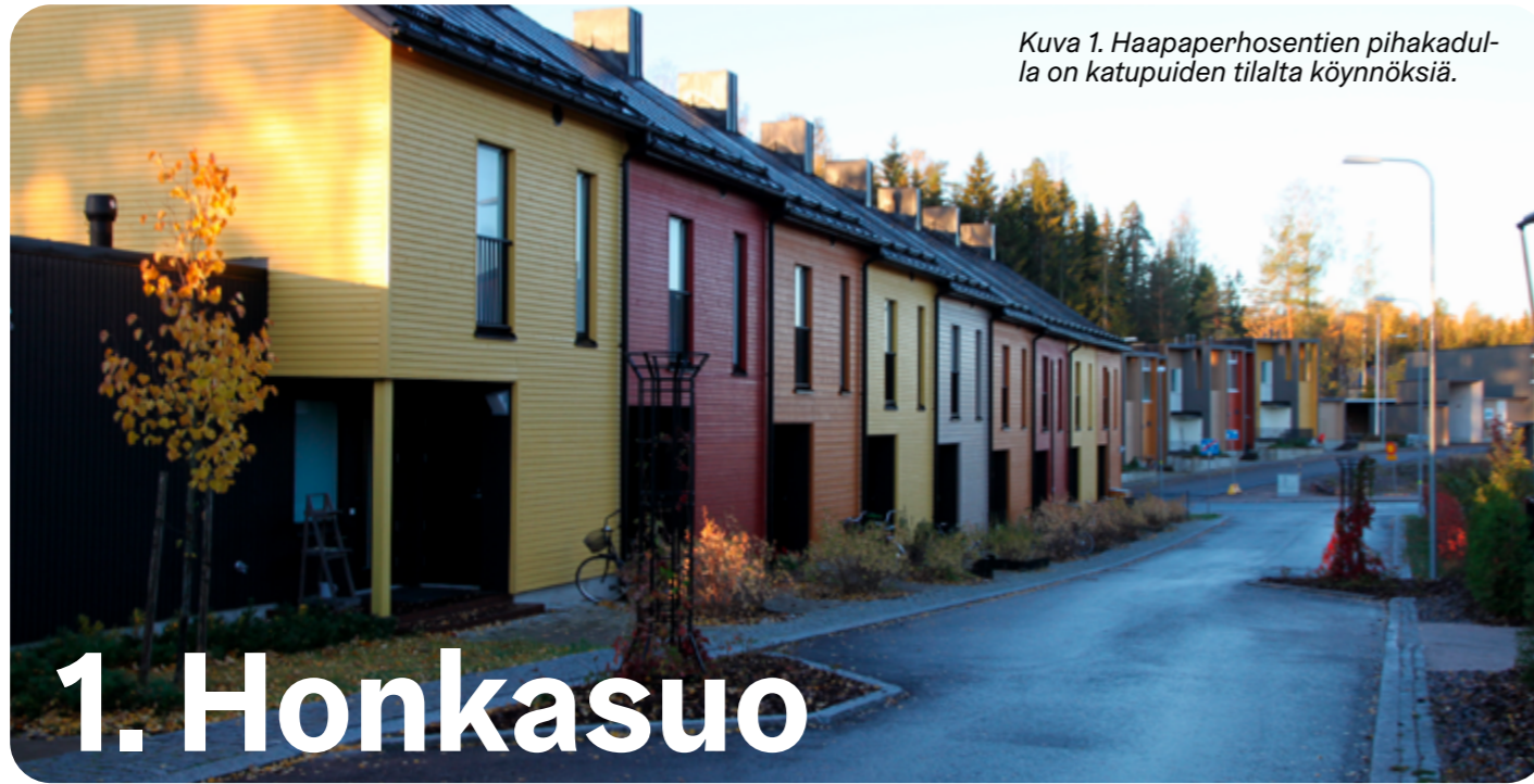
Kuva 1. Haapaperhosentien pihakadulla on katupuiden tilalta köynnöksiä.