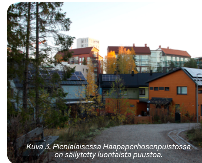
Kuva 3. Pienialaisessa Haapaperhosenupuistossa on säilytetty luontaista puustoa.

Honkasuo kuuluu Mätäjoen valuma-alueeseen. Alueen länsireuna on soista metsää. Puistoalueilla, kuten Niityperhosenupuistossa ja Pihkapuistossa on hulevesirakenteita, kuten hulevesien viivytyksaltaita, joilla on pyritty varautumaan rakentamiseen aiheuttamiin vesitalouden muutoksiin.