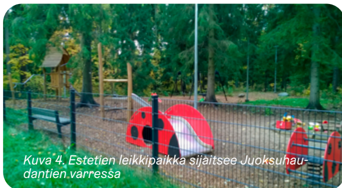
Kuva 4. Estetien leikkipaikka sijaitsee Juoksuhaudantien varressa