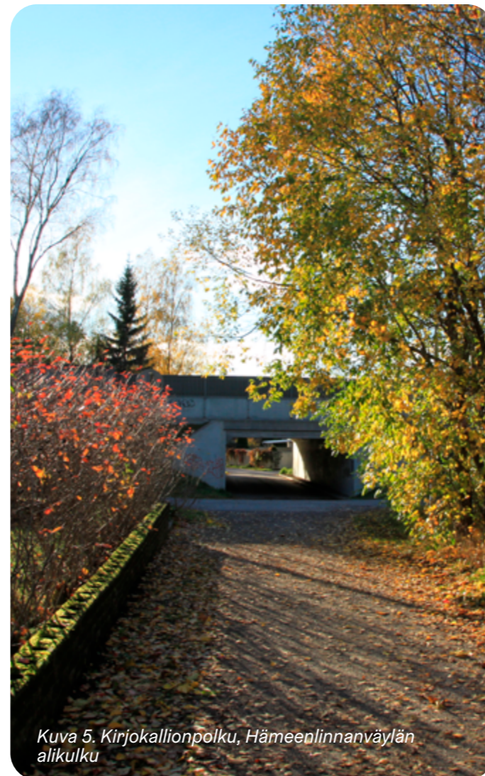
Kuva 5. Kirjokallionpolku, Hämeenlinnanväylän alikulku