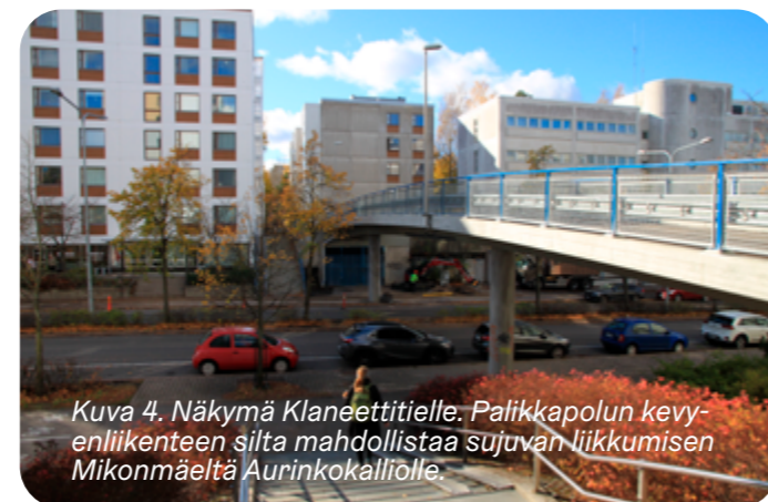
Kuva 4. Näkymä Klaneettitielle. Palikkapolun kevyenliikenteen silta mahdollistaa sujuvan liikkumisen Mikonmäeltä Aurinkokalliolle.