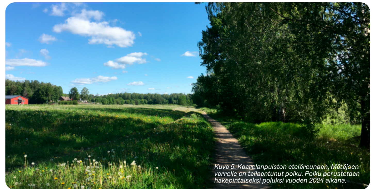
Kuva 5. Kaarelanpuiston eteläreunaan, Mätäjoen varrelle on talleantunut polku. Polku perustetaan hakepintaiseksi poluksi vuoden 2024 aikana.