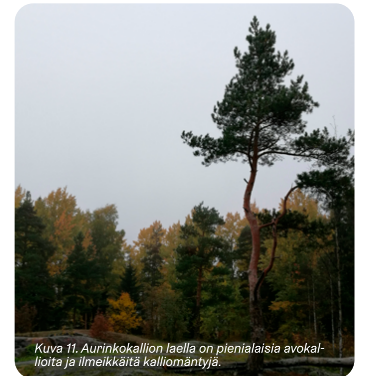
Kuva 11. Aurinkokallion laella on pienialaisia avokallioita ja ilmeikkäitä kalliomäntyjä.