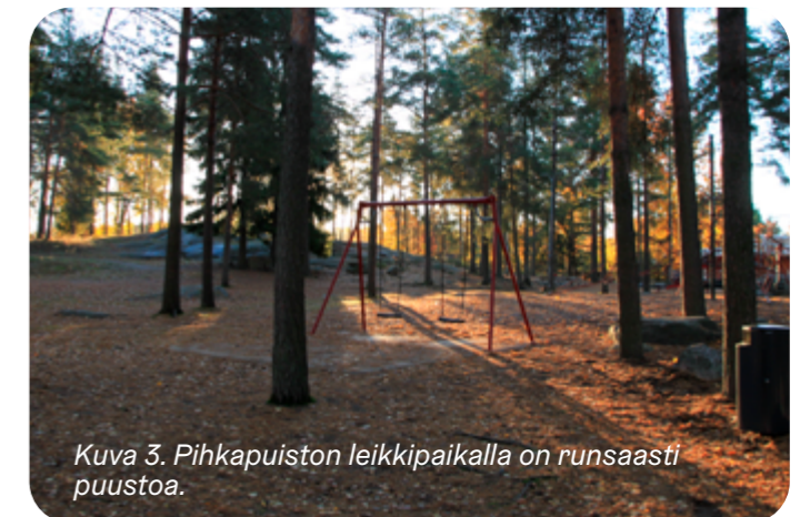
Kuva 3. Pihkapuiston leikkipaikalla on runsaasti puustoa.

Puustoisien verkoston merkittävin metsäalue on Kartanonmetsä Malminkartanon keskellä. Metsikköjä on lisäksi alueen länsireunalla Konalan toimitila-alueen sivulla ja pohjoispuolella Pihkapuistossa. Puustoista verkostoa täydentävät puuvartinen kasvillisuus katujen varsilla ja puistoissa. Myös asuinpihojen kasvillisuus on tärkeä osa verkostoa.