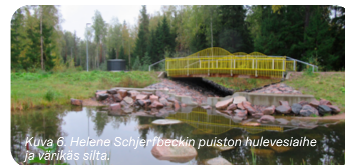
Kuva 6. Helene Schjerfbeckin puiston hulevesiaihe ja värikäs silta.