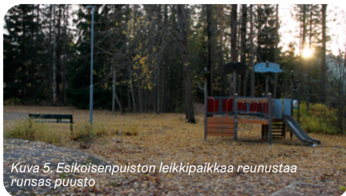
Kuva 5. Esikoisenpuiston leikkipaikkaa reunustaa runsas puusto