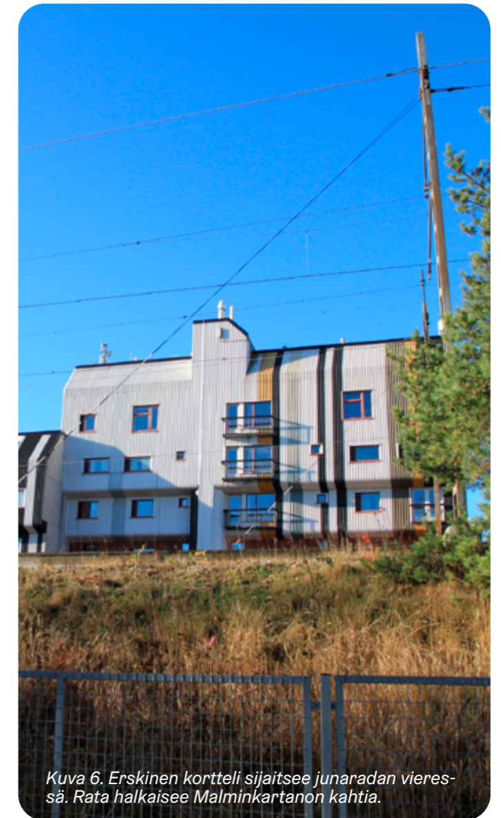
Kuva 6. Erskinen kortteli sijaitsee junaradan vieressä. Rata halkaisee Malminkartanon kahtia.