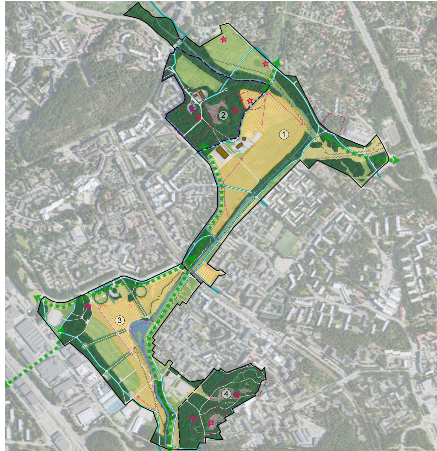
Kuva 6. Osa-alueen nykyinen maisematila ja maiseman kehittämistavoitteet.

Alue on jaettu luonteeltaan erilaisiin maisema-alueisiin. Aluekorteissa esitetään pääasiassa maisemakuvallisia tavoitteita, jotka nojautuvat tietoon ja havaintoihin alueiden luonnosta, kulttuurista ja käytöstä.