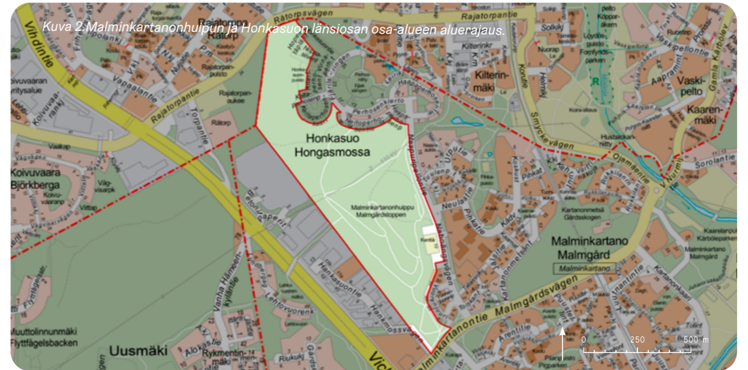
Kuva 2. Malminkartanonhuipun ja Honkasuon länsiosan osa-alueen aluerajaus.