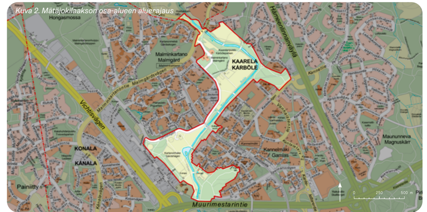
Kuva 2. Mätäjokilaakson osa-alueen aluerajaus