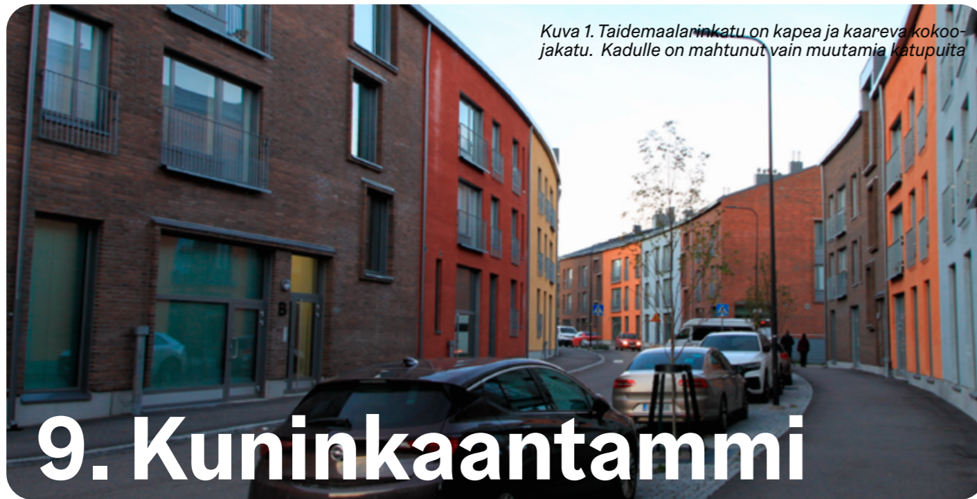
Kuva 1. Taidemaalarininkatu on kapea ja kaareva kokonajakatu. Kadulle on mahtunut vain muutamia katupuuta