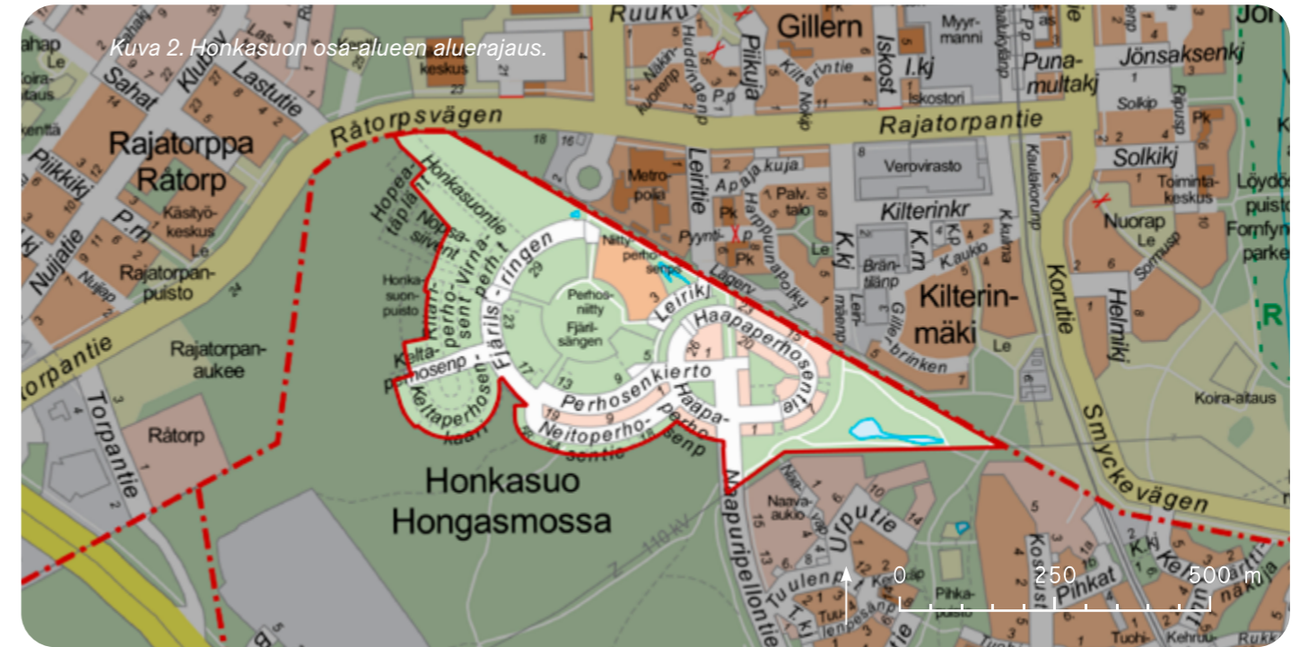
Kuva 2. Honkasuon osa-alueen aluerajaus.