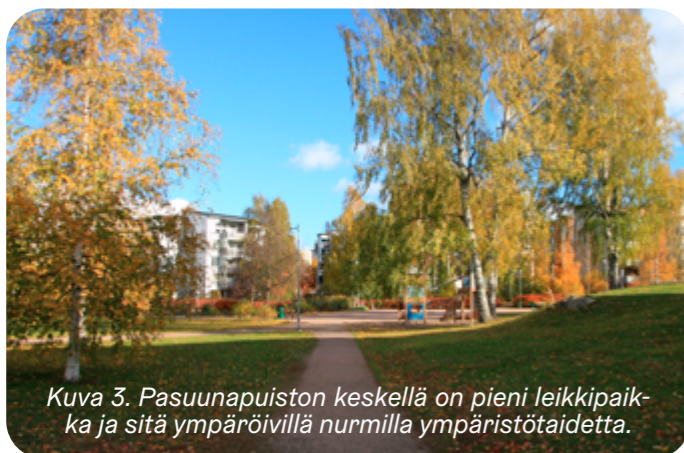
Kuva 3. Pasuunapuiston keskellä on pieni leikkipaikka ja sitä ympäröivillä nurmilla ympäristötaidetta.