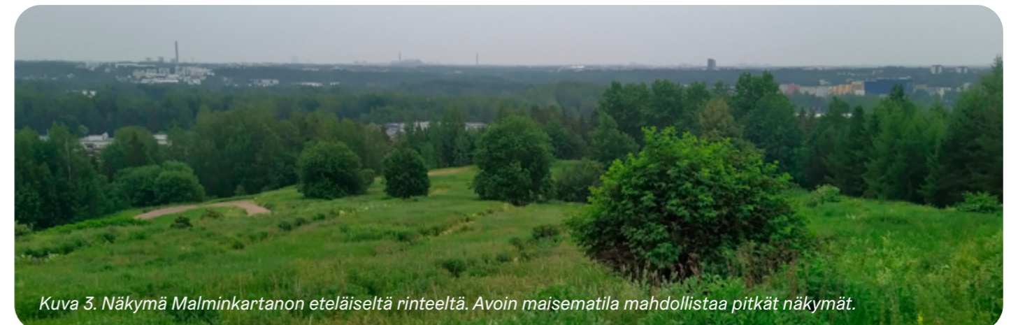
Kuva 3. Näkymä Malminkartanon eteläiseltä rinteeltä. Avoin maisematila mahdollistaa pitkät näkymät.

Alueella on kaksi geologisesti arvokasta kohdetta: Honkasuon asuinalueen länsipuolinen rahkaturvekerrostuma sekä Honkasuon ja pohjoispuoleisen täyttömäen välinen muinaisranta kivikko eli niin kutsuttu piirunpelto.