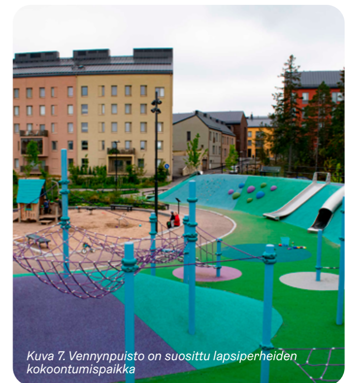
Kuva 7. Vennynpuisto on suosittu lapsiperheiden kokoontumispaikka