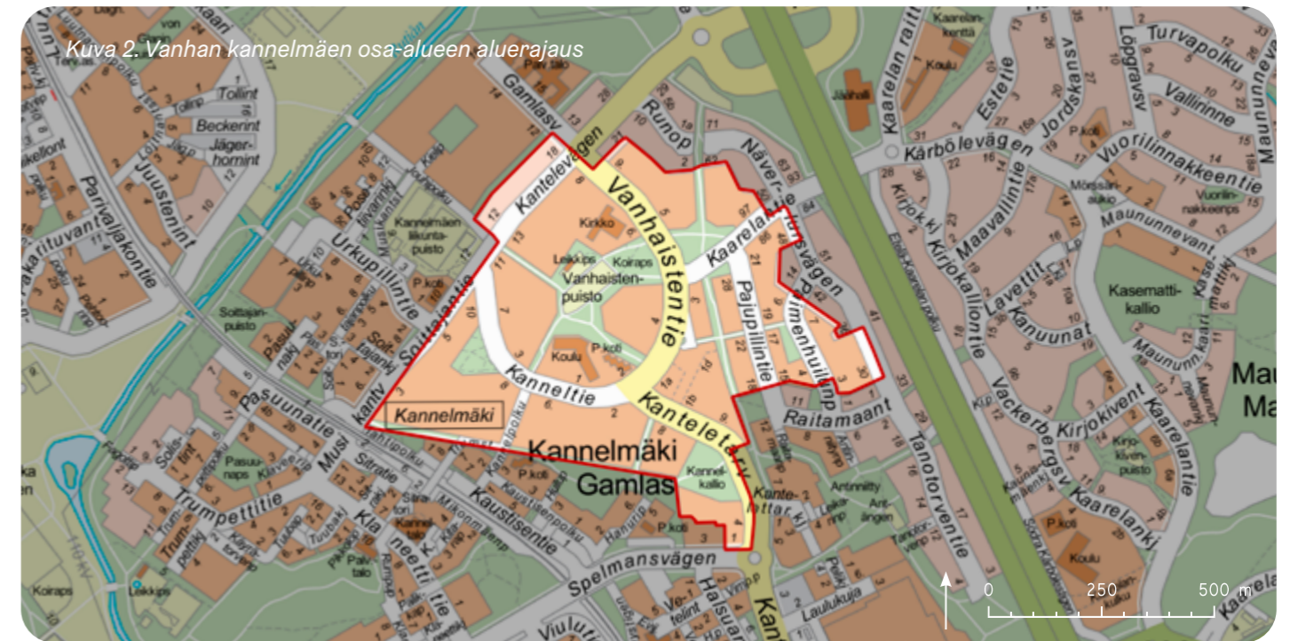
Kuva 2. Vanhan kannelmäen osa-alueen aluerajaus