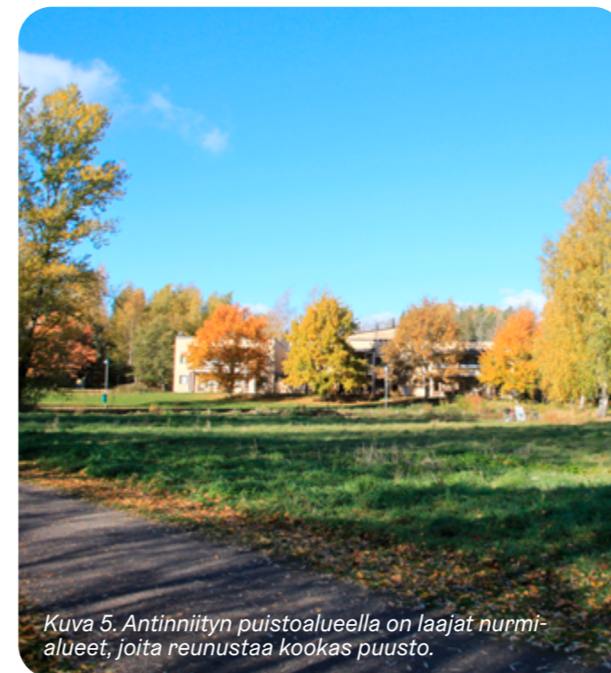
Kuva 5. Antinniityn puistoalueella on laajat nurmi-alueet, joita reunustaa kookas puusto.