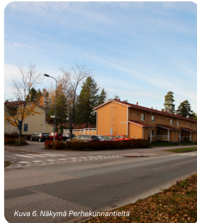
Kuva 6. Näkymä Perhekunnantieltä