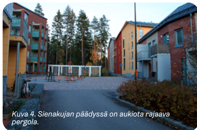
Kuva 4. Sienakujan päädyssä on aukiota rajaava pergola.