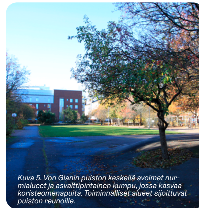
Kuva 5. Von Glanin puiston keskellä avoimet nurmialueet ja asfalttipintainen kumpu, jossa kasvaa koristeomenapuita. Toiminnalliset alueet sijoittuvat puiston reunoille.