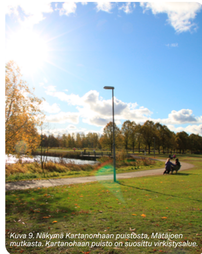
Kuva 9. Näkymä Kartanohaahan puistosta, Mätäjoen mutkasta. Kartanohaahan puisto on suosittu virkistysalue.

Eteläinen jokilaakson alue käsittää pääosin savikoilla sijainneita ja nykyiselläänkin suurelta osin avarina säilyneitä entisiä viljelyalueita, joiden alueelle rakentui 1980- ja 1990-lukujen aikana Kartanohaahan puistoalue. Entisille pelloille istutettiin tällöin puukujanteita sekä sommiteltiin erilaisia muotoaiheita puilla ja korkeilla pensailla. Nykyisellään Kartanohaka on suosittu virkistysalue ja alueella on paljon erilaisia toimintoja: Leikkipuisto Trumpetti, kaksi skeittipaikkaa ja hiekkakenttää, grillipaikka, koira-aitaus, viljelypajoja, oleskelulaituri ja kattava käytäväverkosto. Alueen pohjoisreunalla on lumen vastaanottoaika, pysäköintialue sekä Kartanonkaaren suuntainen avo-oja, joka jatkuu myös yhtenä pohjois-eteläsuuntaisena ojana puistoon. Puistoalueen länsireunalla on puustoinen reunavyöhyke, joka rajaa jokilaakson avoimia alueita Konalan teollisuusalueen ja Kartanonkaaren katu ympäristöä vasten. Viljelypalojen pohjoispuolella oleva selänne on ollut metsikköinen jo viljelysajalta lähtien ja mäellä on ollut kivikautinen asuinpaikka. Mätäjoen ranta on suureksi osaksi avointa, ja joki erottuu alueella selvästi ympäristöstään. Puistoalueen keskellä joki levenee laajemmaksi suvannoksi, jonka keskellä on tekosaari. Leikkipuisto Trumpetin edustalla sijaitsee pieni kunnostettu koski.