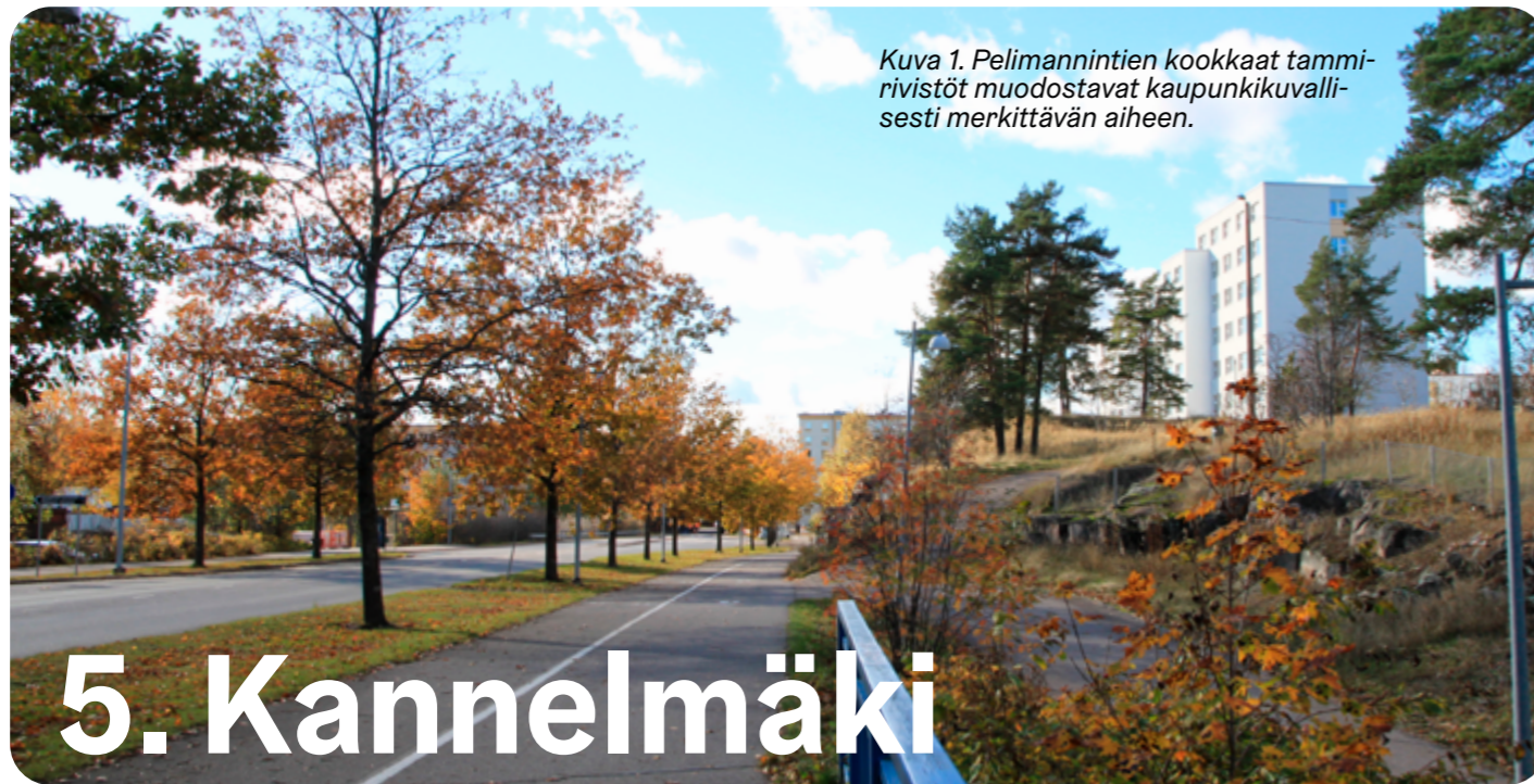
Kuva 1. Pelimannintien kookkaat tammi- rivistöt muodostavat kaupunkikuvalli- sesti merkittävän aiheen.