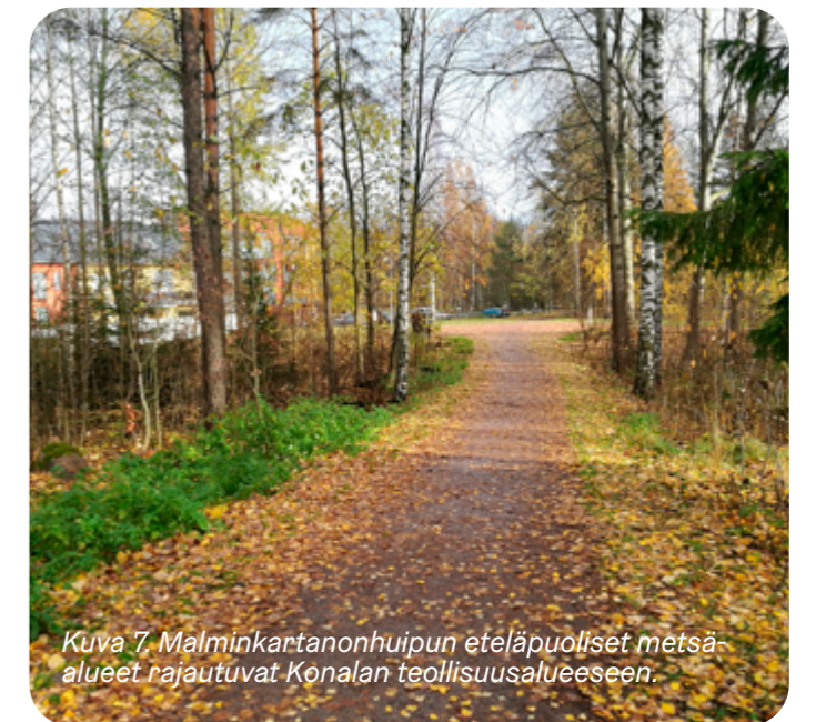
Kuva 7 Malminkartanonhuipun eteläpuoliset metsä-alueet rajautuvat Konalan teollisuusalueeseen.