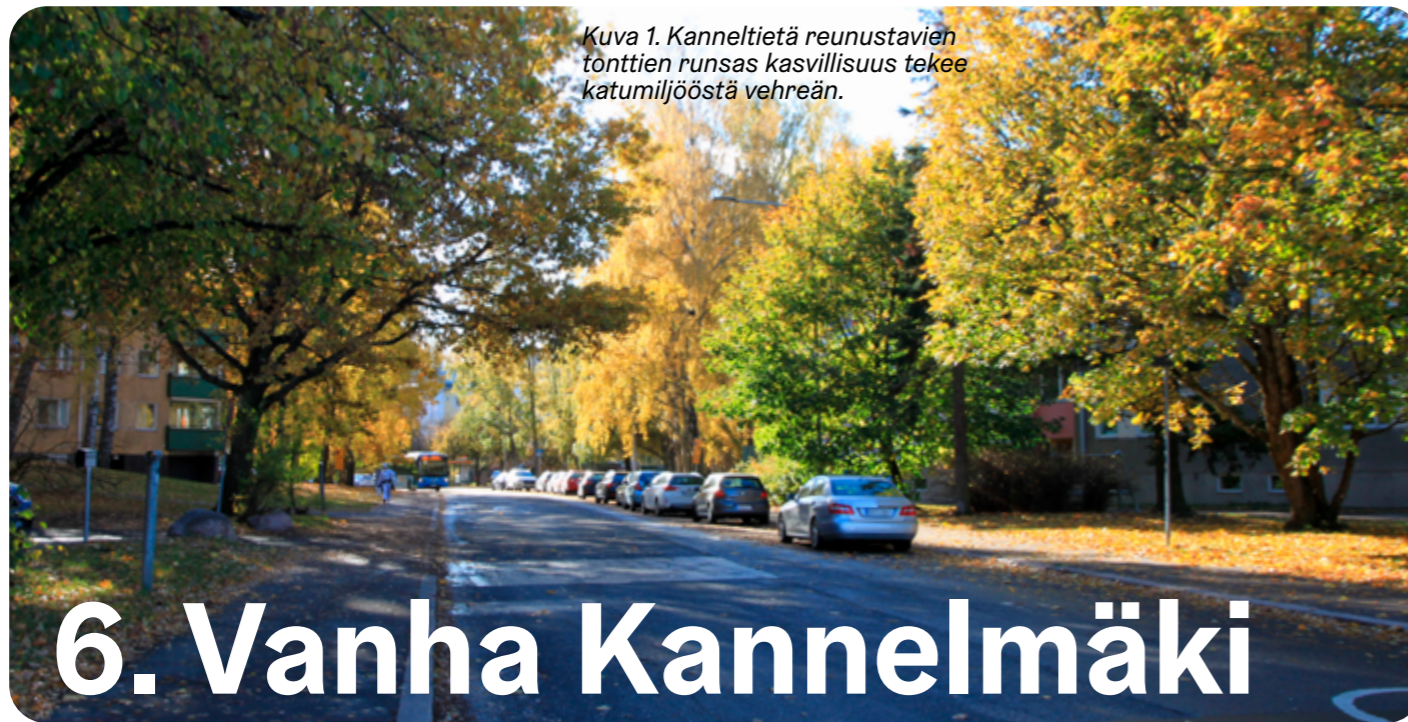
Kuva 1. Kanneltietä reunustavien tonttien runsas kasvillisuus tekee katumiljööstä vehreän.