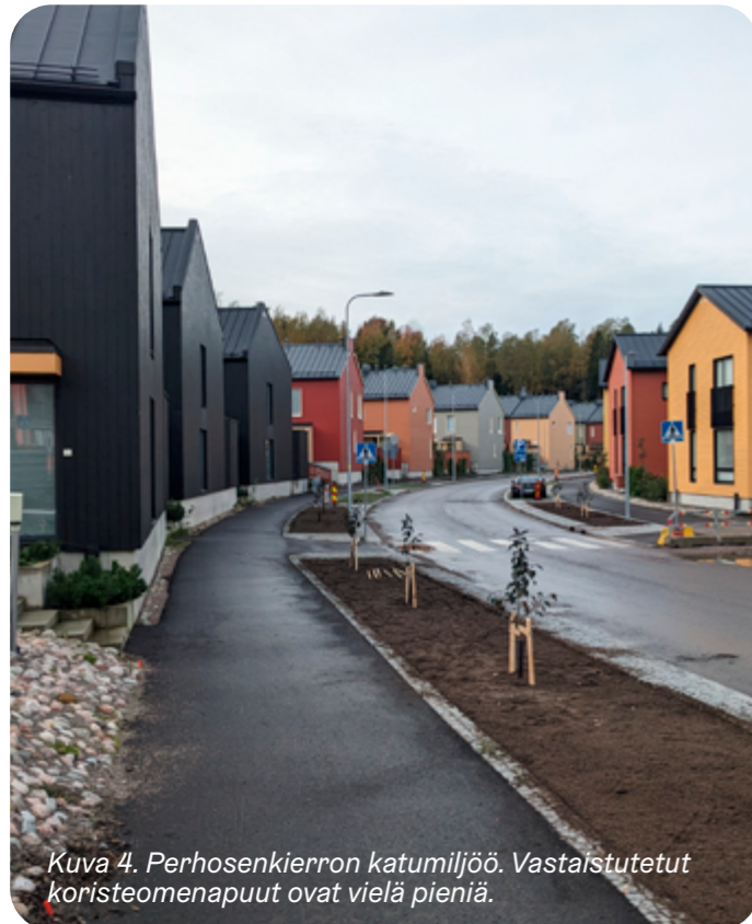
Kuva 4. Perhosenkierron katumiljö. Vastaistutetut koristeomenapuu ovat vielä pieniä.