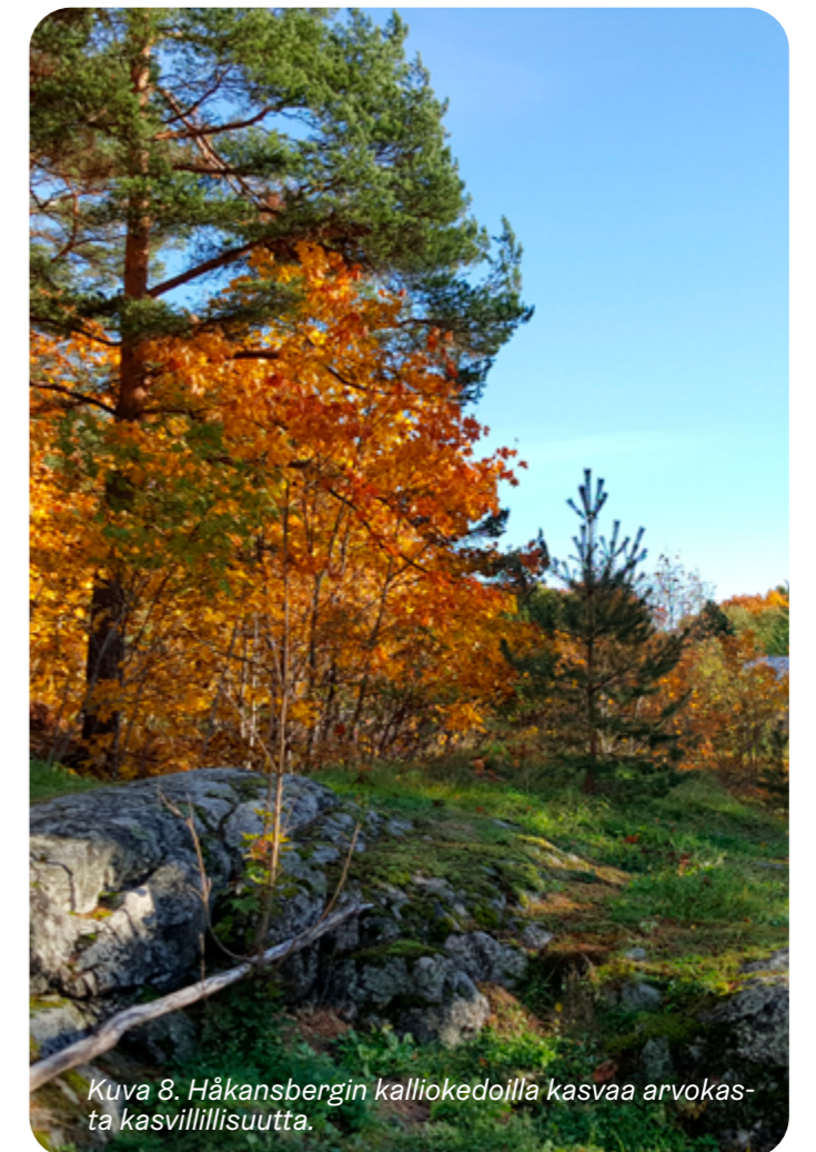
Kuva 8. Håkansbergin kalliokeoilla kasvaa arvokasta kasvillisuutta.