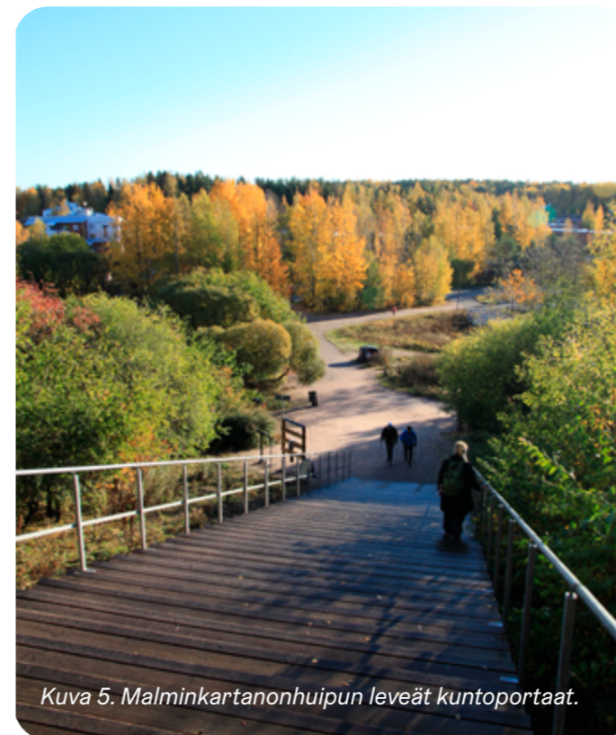
Kuva 5. Malminkartanonhuipun leveät kuntoportaat.