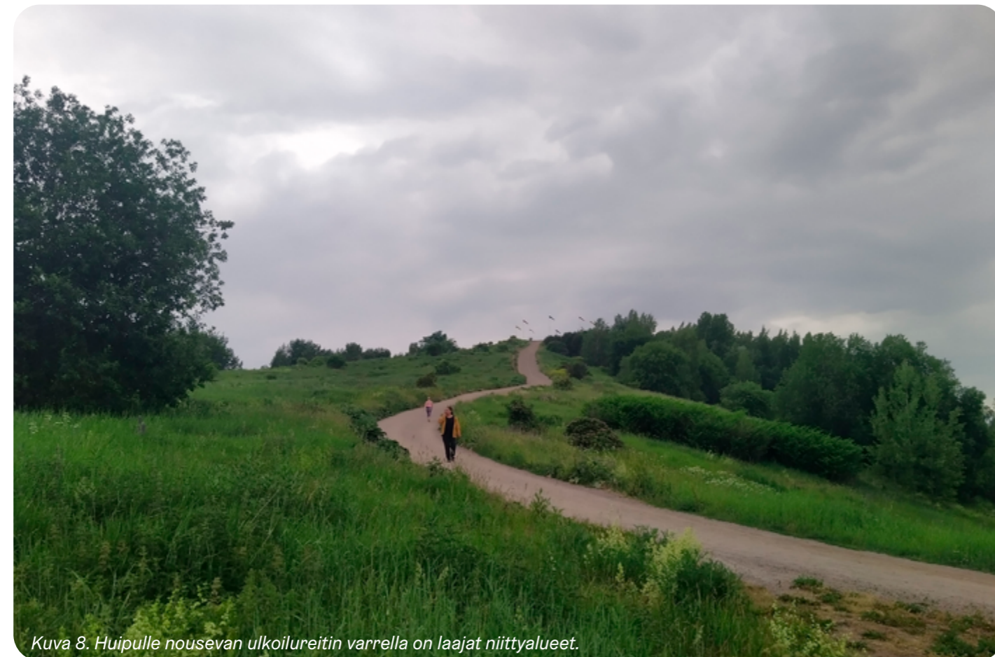
Kuva 8. Huipulle nousevan ulkoilureitin varrella on laajat niittyalueet.