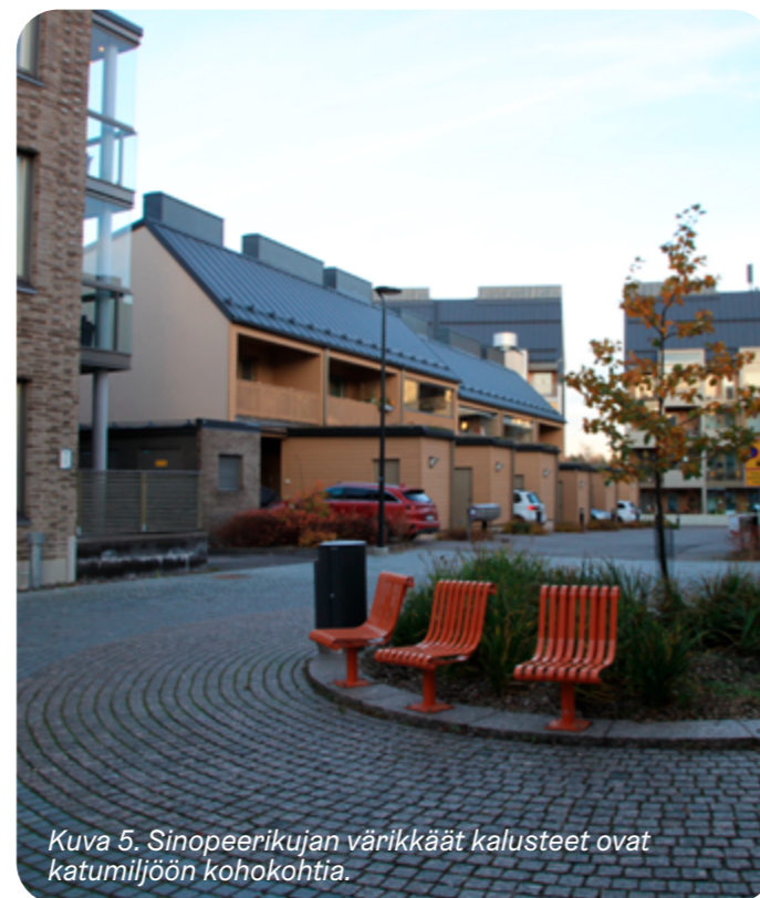
Kuva 5. Sinopeerikujan värikkäät kalusteet ovat katumiljöön kohokohtia.