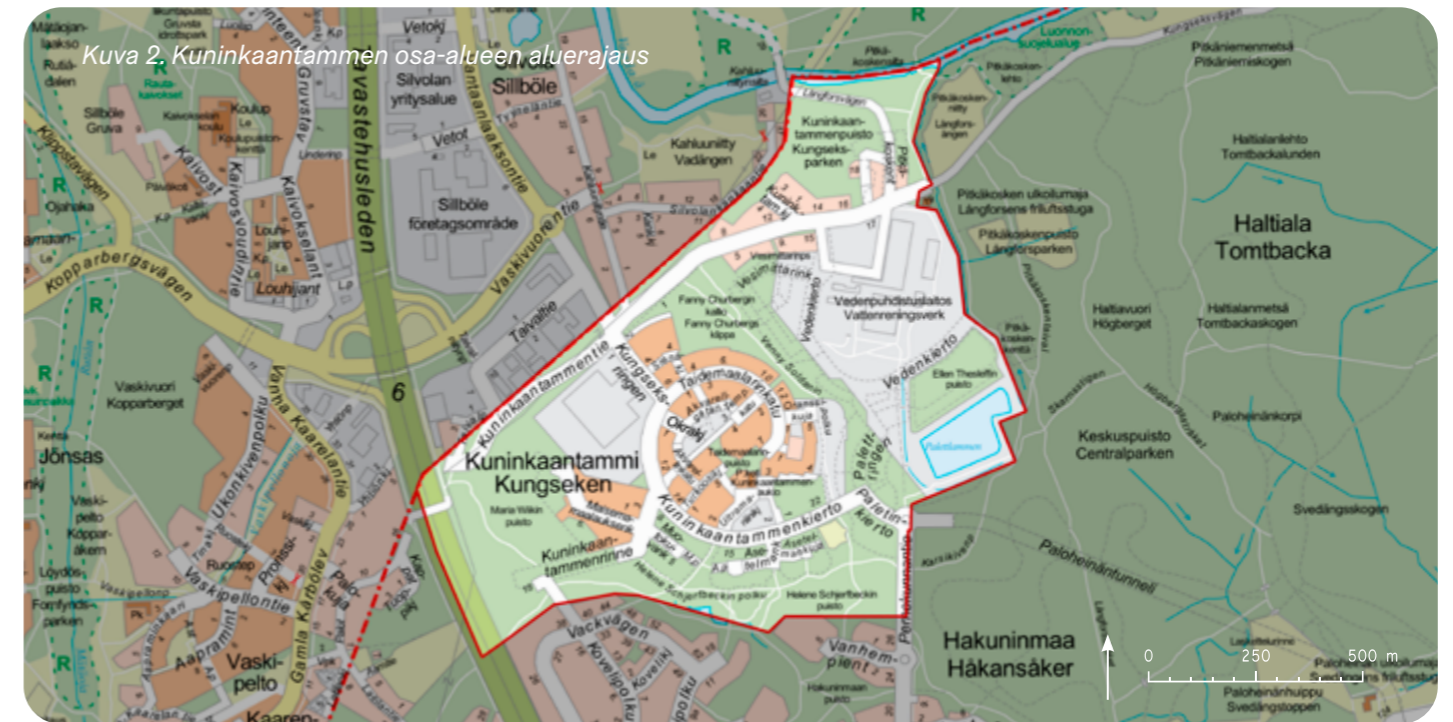
Kuva 2. Kuninkaantammi osa-alueen aluerajaus