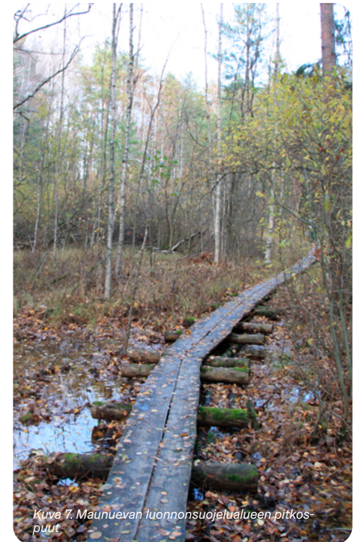
Kuva 7. Maunuevan luonnonsuojelualueen pitkospuut