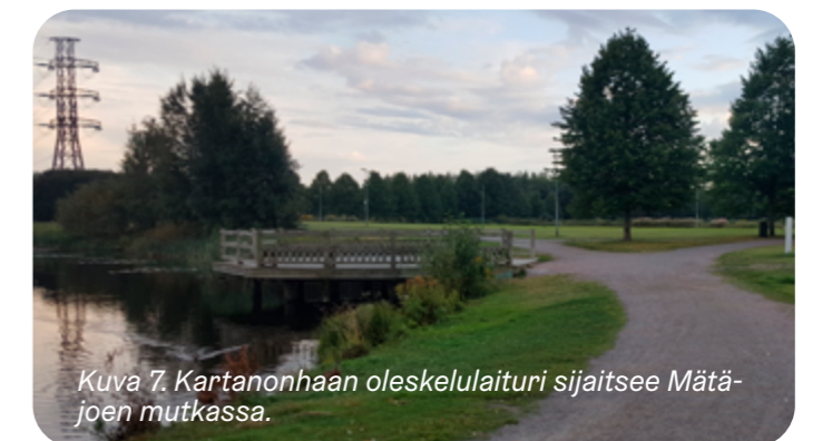
Kuva 7. Kartanonhaan oleskelulaituri sijaitsee Mätäjoen mutkassa.