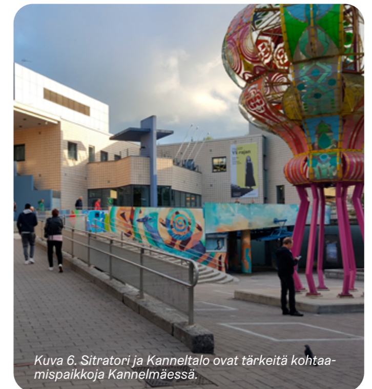
Kuva 6. Sitrator ja Kanneltalo ovat tärkeitä kohtauspaikkoja Kannelmäessä.