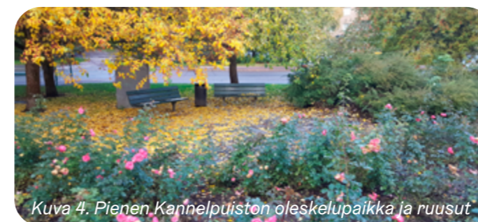
Kuva 4. Pienen Kannelpuiston oleskelupaikka ja ruusut