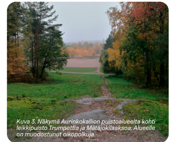
Kuva 3. Näkymä Aurinkokallion puistoalueelta kohti leikkipuisto Trumpettia ja Mätäjokilaaksoa. Alueelle on muodostunut oikopolkuja.

Mätäjokilaakson puustoinen verkosto koostuu Kaarelanpuiston, kartanoympäristön ja niin kutsutun Juhannuskallion metsiköstä, joen keskivaiheilla sijaitsevasta jalavametsiköstä, Kartanonhaan pohjois- ja länsisivujen metsiköistä, Aurinkokallion ja Muurimestarintien pohjoispuoleisesta metsäalueesta sekä joen varren ja uoman puustosta. Verkostoa täydentävät puistojen puuistutukset sekä jokivarren kookas pensasto. Iso osa alueen puustosta on verrattain nuorta ja monin paikoin alkujaan istutusperäistä. Jokilaakson keski-osassa puustoiset alueet sijaitsevat suurelta osin kaipaavina ja katkonaisina nauhoina avoimien alueiden reunoilla. Myös laaksoaluetta halkovat voimalinjat luovat katkoksia puustoiseen verkostoon.