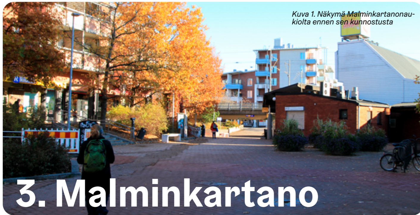
Kuva 1. Näkymä Malminkartanonaukiolta ennen sen kunnostusta