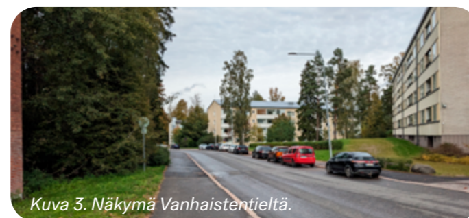
Kuva 3. Näkymä Vanhaistentieltä.