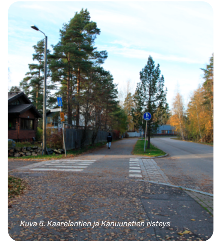
Kuva 6. Kaarelantien ja Kanuunatien risteys