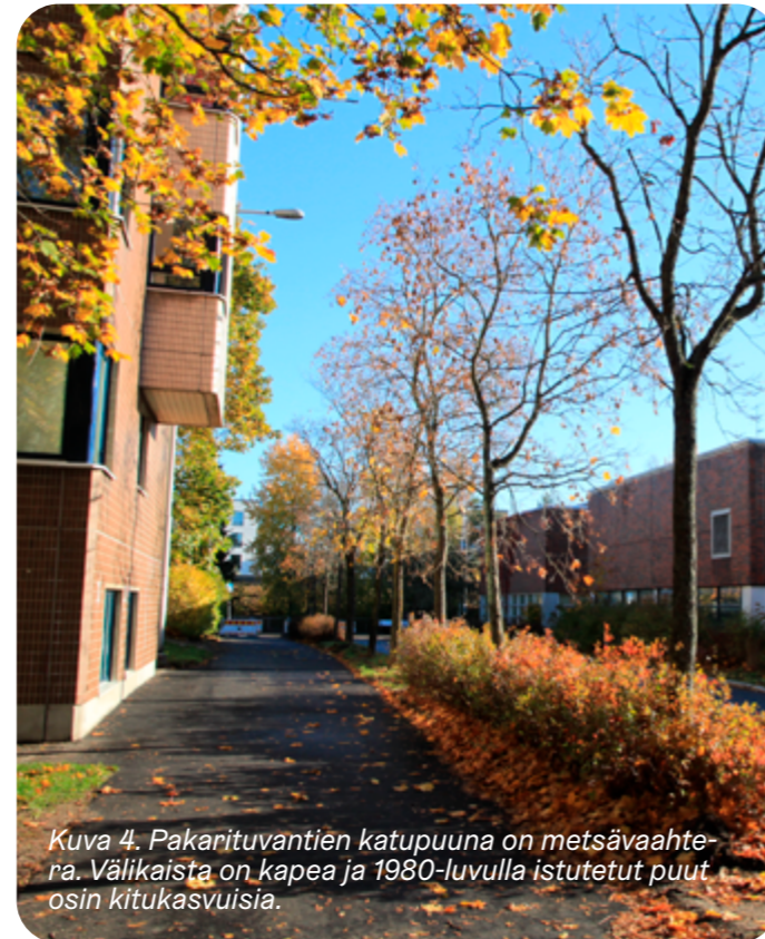
Kuva 4. Pakariturvantiän katupuuna on metsävaahtera. Välikaista on kapea ja 1980-luvulla istutetut puut osin kitukasvuisia.