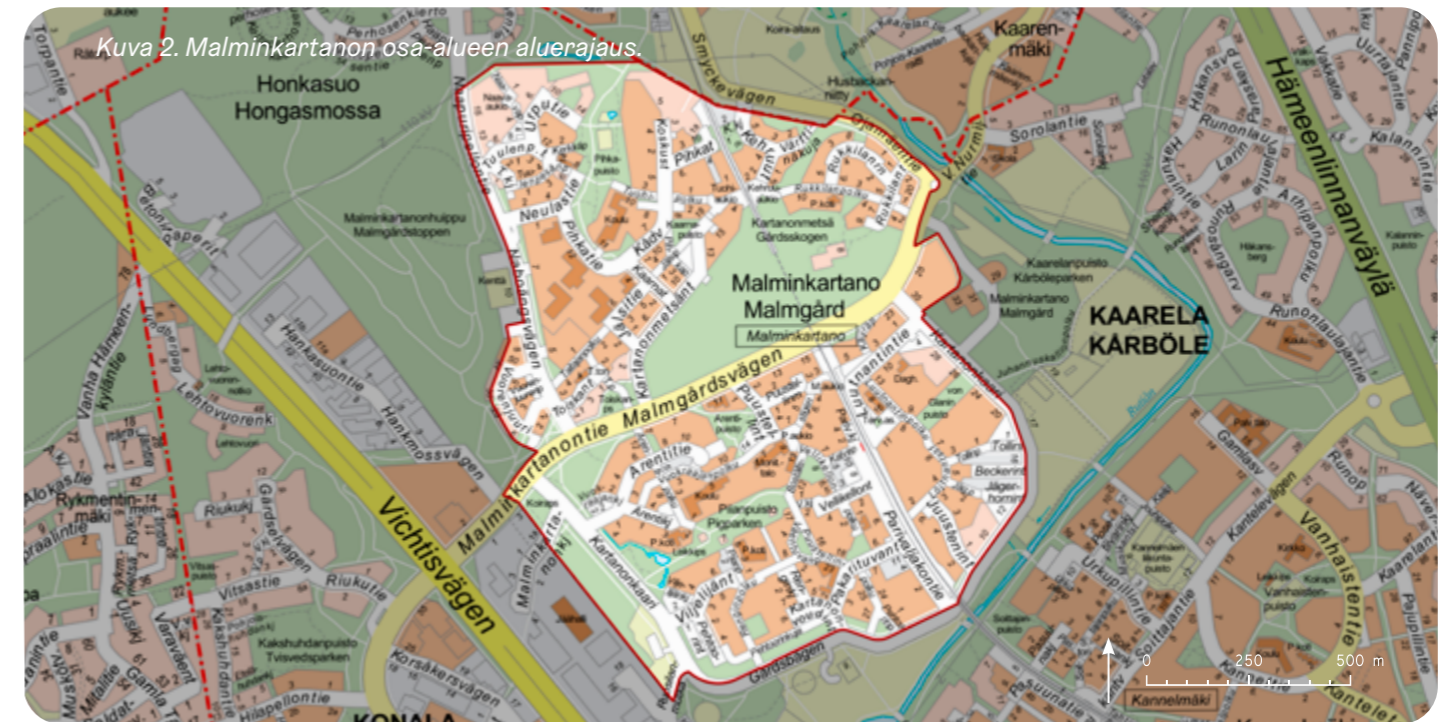
Kuva 2. Malminkartanon osa-alueen aluerajaus.