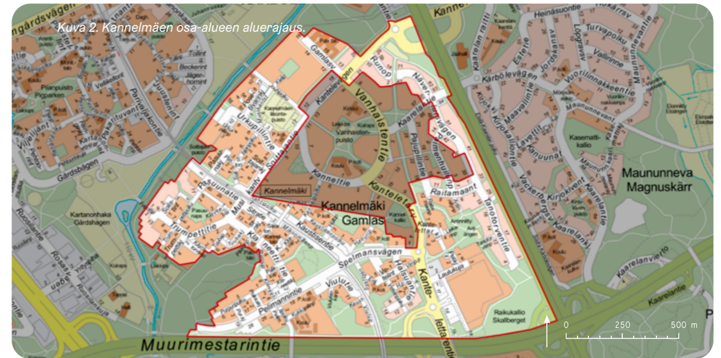
Kuva 2. Kannelmäen osa-alueen aluerajaus.

Alueen rakennetut puistot sijaitsevat entisillä niitty- ja peltoalueilla. Selännealueen puistoalueilla on säilynyt pienialaisia metsiköitä ja niukkapuustoisia kalliometsiä ja sekä Kehä I:sen ja Hämeenlinnanväylän varrella suojapuustoa. Tiiviin kaupunkirakenteen vuoksi kulttuurihistorialliset- ja luontoarvot keskittyvät niittyalueille sekä kalliometsiköihin. Alueen länsireunalle ulottuva, kaupunginosan keskeinen puistoalue Kartanonhaka on luokiteltu Helsingin yleisten alueiden arvoympäristöksi, jonka arvo perustuu muun muassa aikakautensa