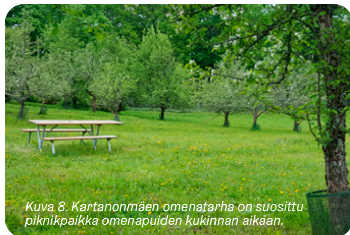
Kuva 8. Kartanomäen omenatarha on suosittu piknikpaikka omenapuiden kukinnan aikaan.