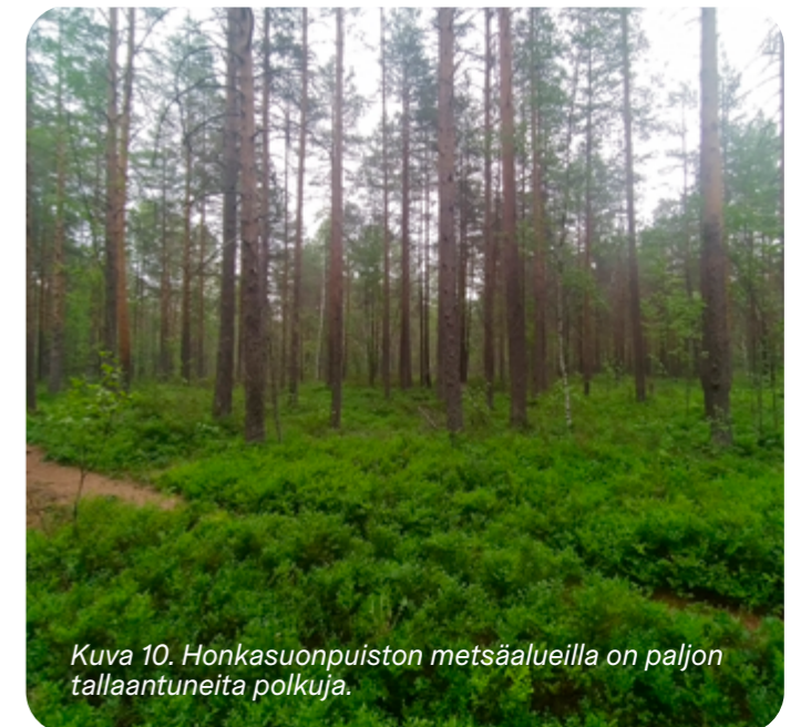
Kuva 10. Honkasuonpuiston metsäalueilla on paljon talleantuneita polkuja.