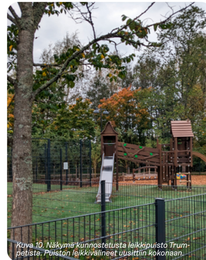
Kuva 10. Näkymä kunnostetusta leikkipuisto Trumpetista. Puiston leikkivälineet uusittiin kokonaan.