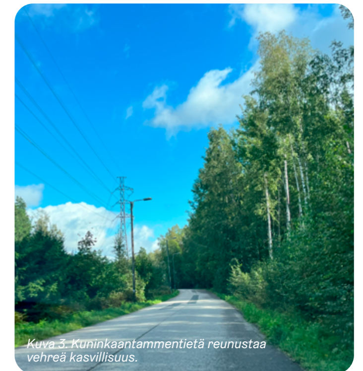
Kuva 3. Kuninkaantammi tietä reunustaa vehreä kasvillisuus.

Kuninkaantammi pohjoisosaa rajaavan Vantaanjokilaakson niittykeskittymä ulottuu Kuninkaantammi puistoon. Niittykeskittymien välillä kulkeva ensisijainen yhteys kulkee Kuninkaantammi tien ja sen vierellä kulkevan voimalinjan kautta Maria Wiikinpuistoon ja siitä eteenpäin Hämeenlinnanväylän yli kohti Mätäjokea. Kuninkaantammi eteläreunassa on verkostoon merkitty irrallisia askelkiviä pitkin kulkeva poikkittais-yhteys - ”mahdollisesti tutkittava yhteys”.