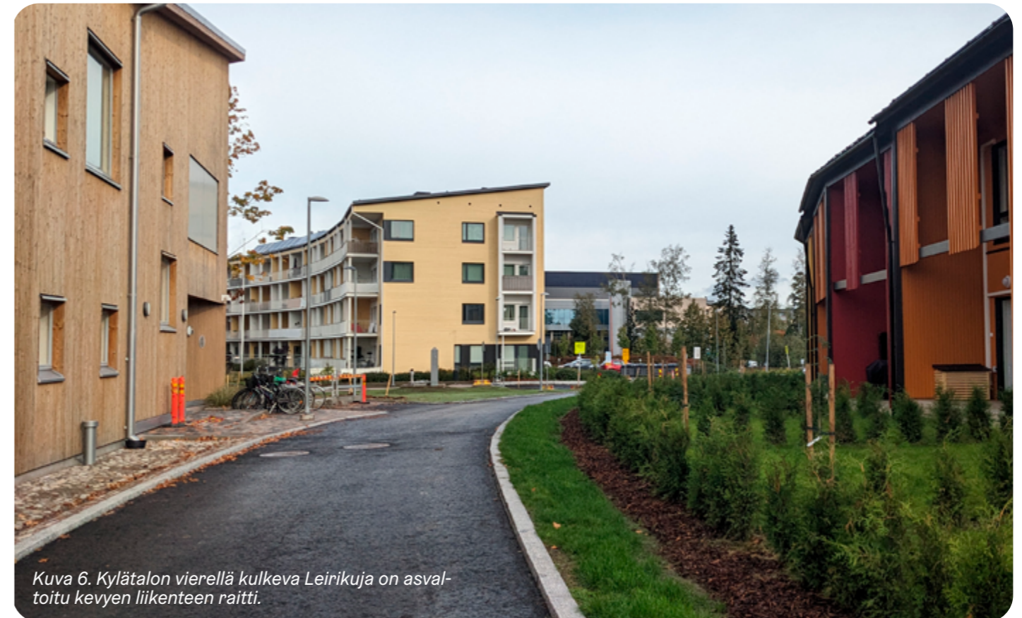
Kuva 6. Kylätalon vierellä kulkeva Leinikuja on asfaltoitu kevyen liikenteen raitti.