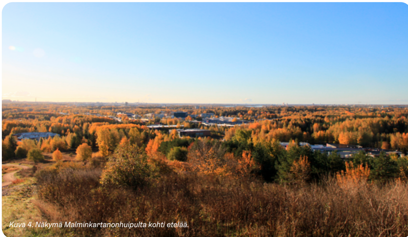
Kuva 4. Näkymä Malminkartanonhuipulta kohti etelää.