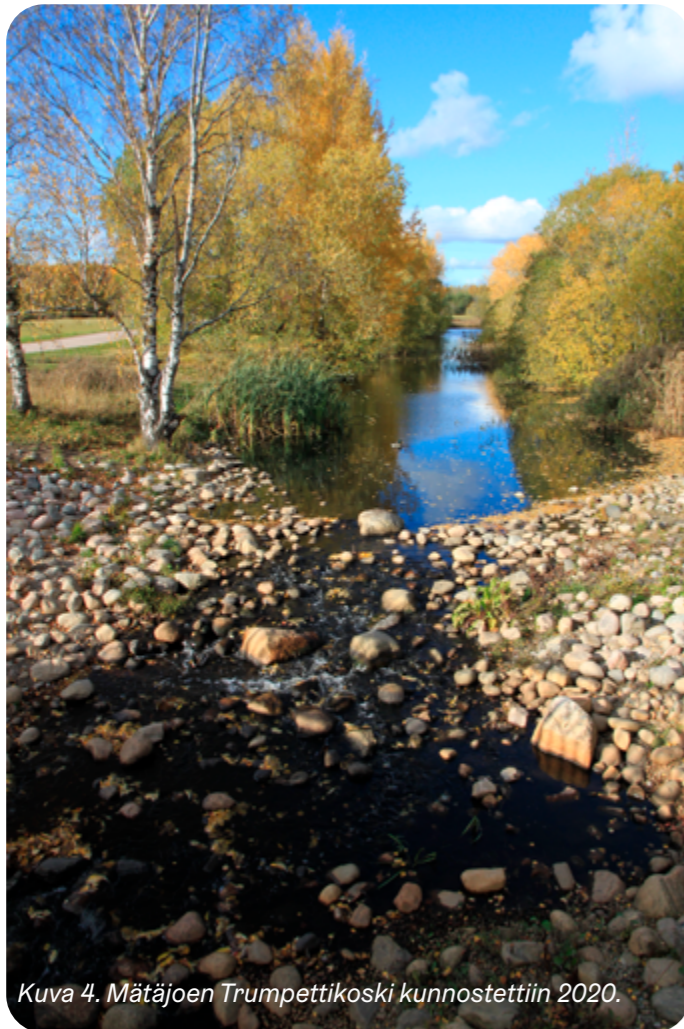
Kuva 4. Mätäjoen Trumpettikoski kunnostettiin 2020.

Alueen siniverkoston tärkein osa on Mätäjoen pääuoma. Sivuojat on monin paikoin putkitettu. Kartanonkaaren varrella sijaitsee avouoman sisältävä koskeikko. Läpäisemättömien pintojen osuus on alueella maltillinen.