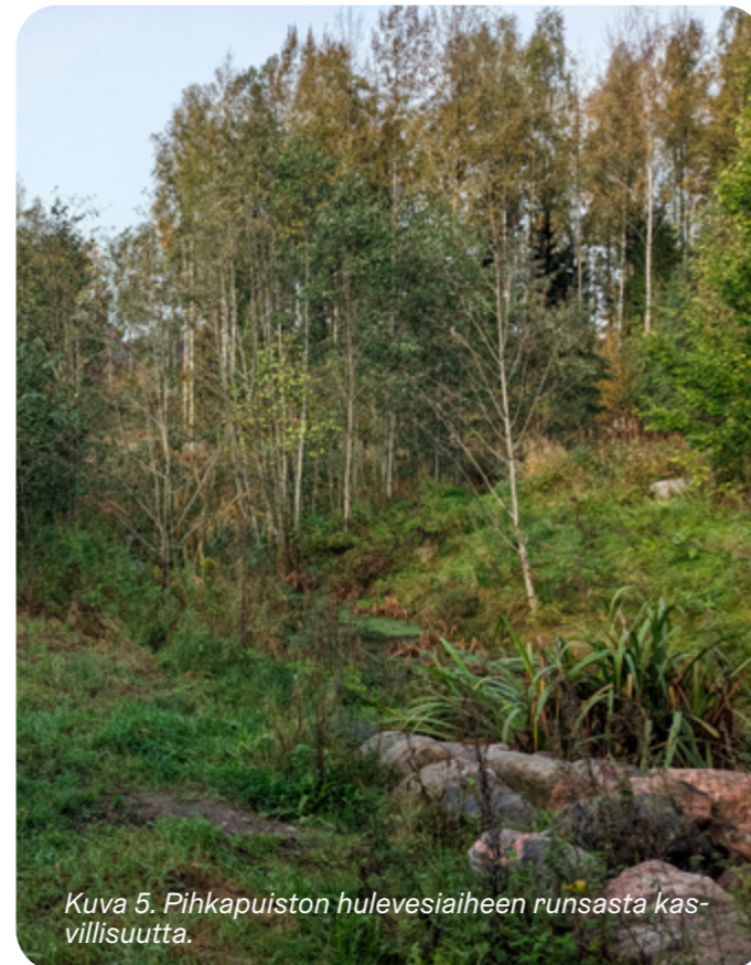
Kuva 5. Pihka-puiston hulevesiaiheen runsasta kasvillisuutta.