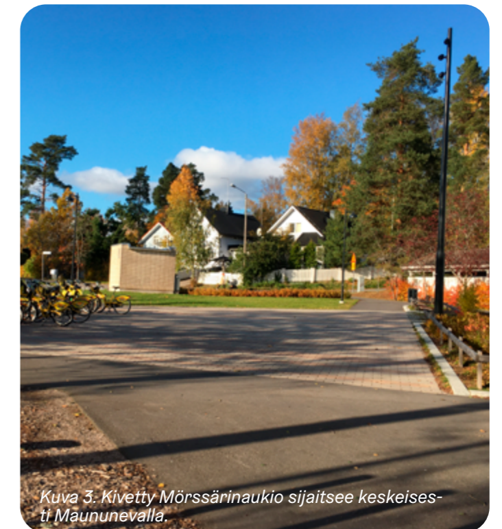
Kuva 3. Kivetty Mörssärin aukio sijaitsee keskeisesti Maununnevilla.

Maununnevan länsiosa kuuluu Mätäjoen valuma-alueeseen, Keskuspuiston vastainen itäosa Haaganpuron valuma-alueeseen ja koilliskulma Näsiinjoen-Tuomarinkylänojan valuma-alueeseen. Alueen läpäisemättömien pintojen osuus on kohtuullisen suuri (17-43%). Alueen pienvesistöt ovat niukat, avouomia on metsäisillä alueilla ja katujen varsilla. Nevanpuiston yhteydessä sijaitseva Maununnevan luonnonsuojelualue käsittää suon.