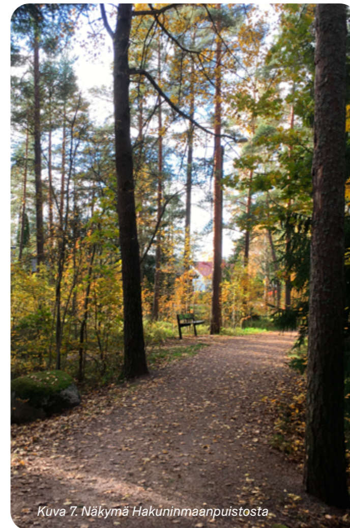
Kuva 7. Näkymä Hakuninmaanpuistosta