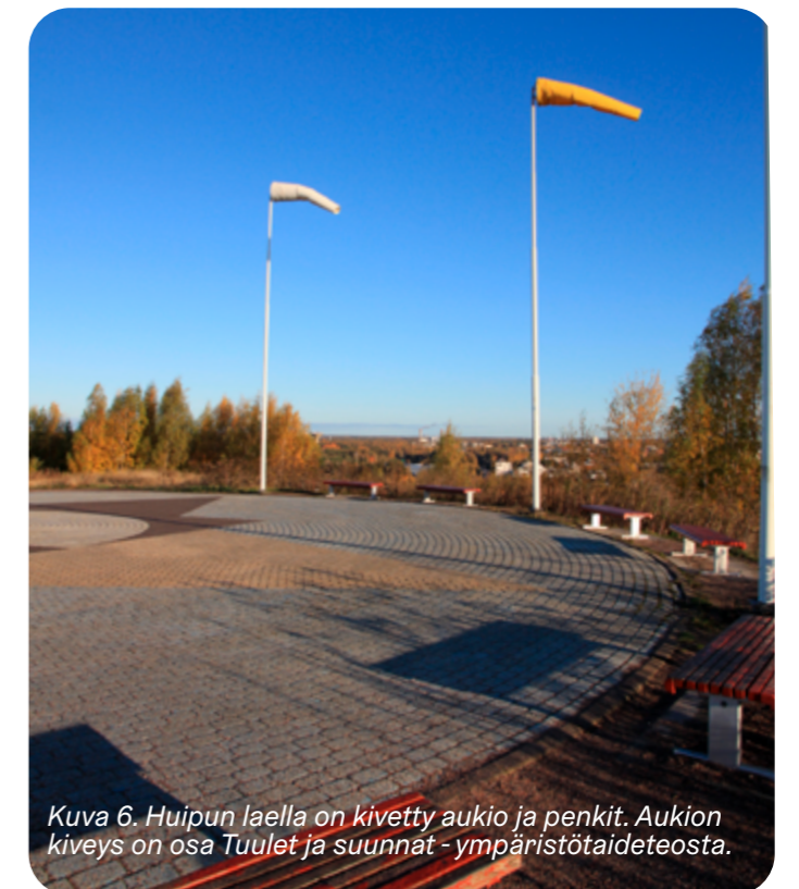
Kuva 6. Huipun laella on kivetty aukio ja penkit. Aukion kiveys on osa Tuulet ja suunnat -ympäristötaideteosta.