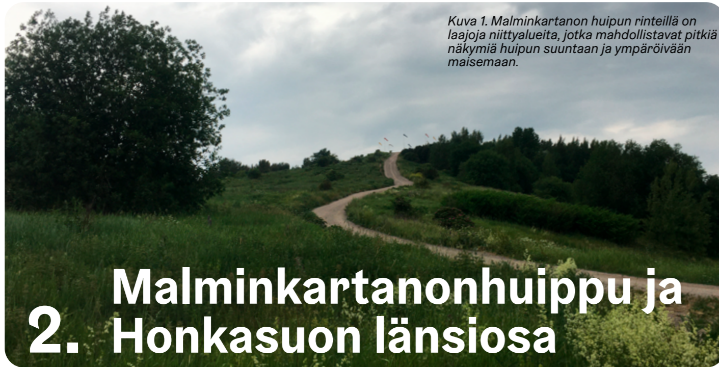
Kuva 1. Malminkartanon huipun rinteillä on laajoja niittyalueita, jotka mahdollistavat pitkiä näkymiä huipun suuntaan ja ympäröivään maisemaan.