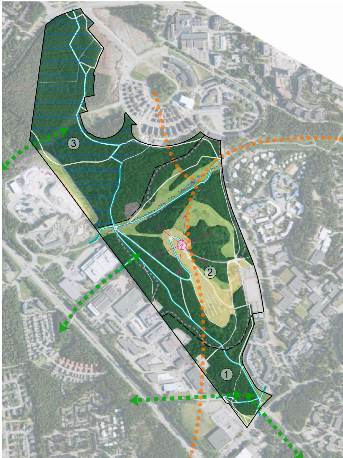
Kuva 6. Osa-alueen nykyinen maisematila ja maiseman kehittämistavoitteet.