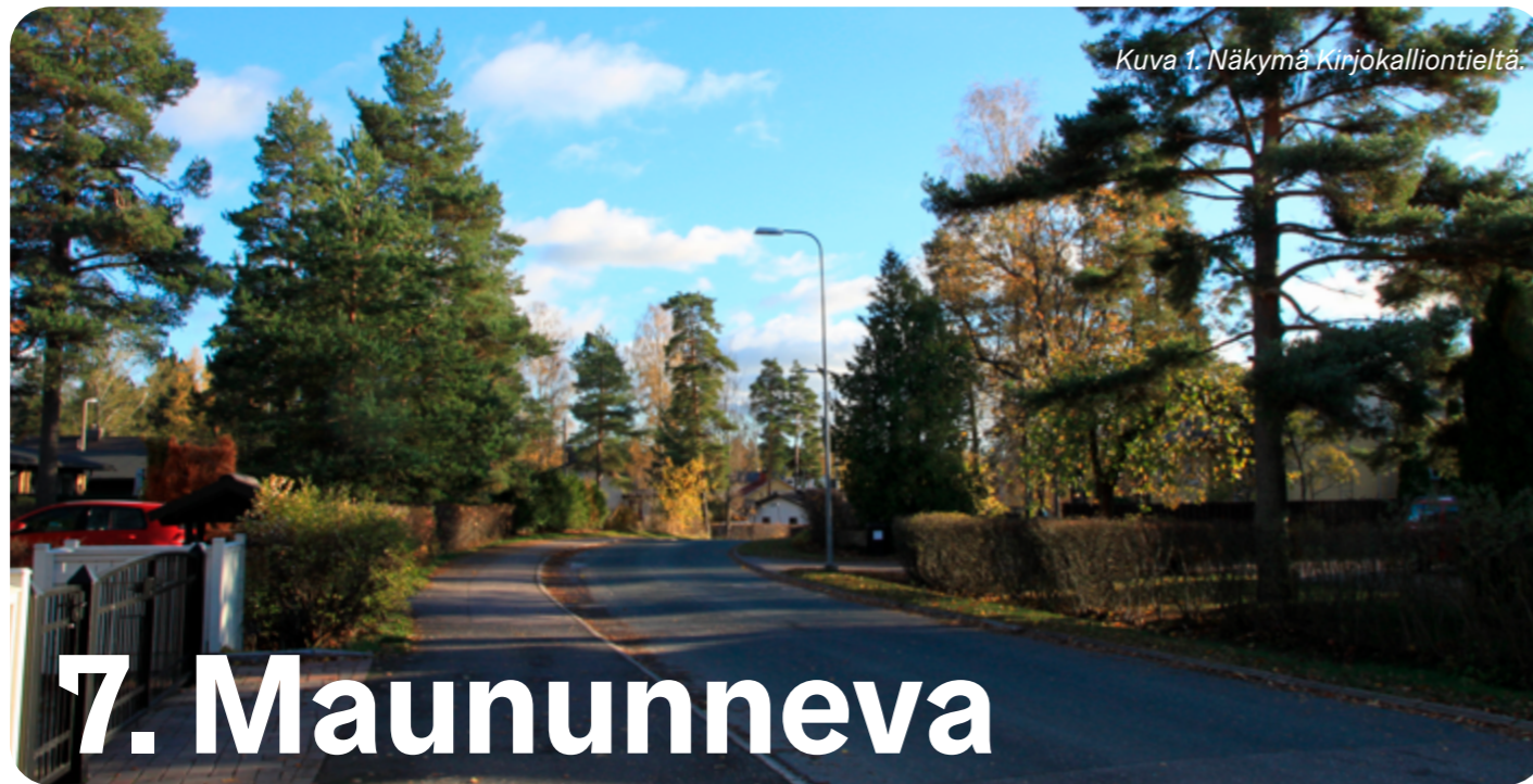
Kuva 1. Näkymä Kirjokalliontieltä.