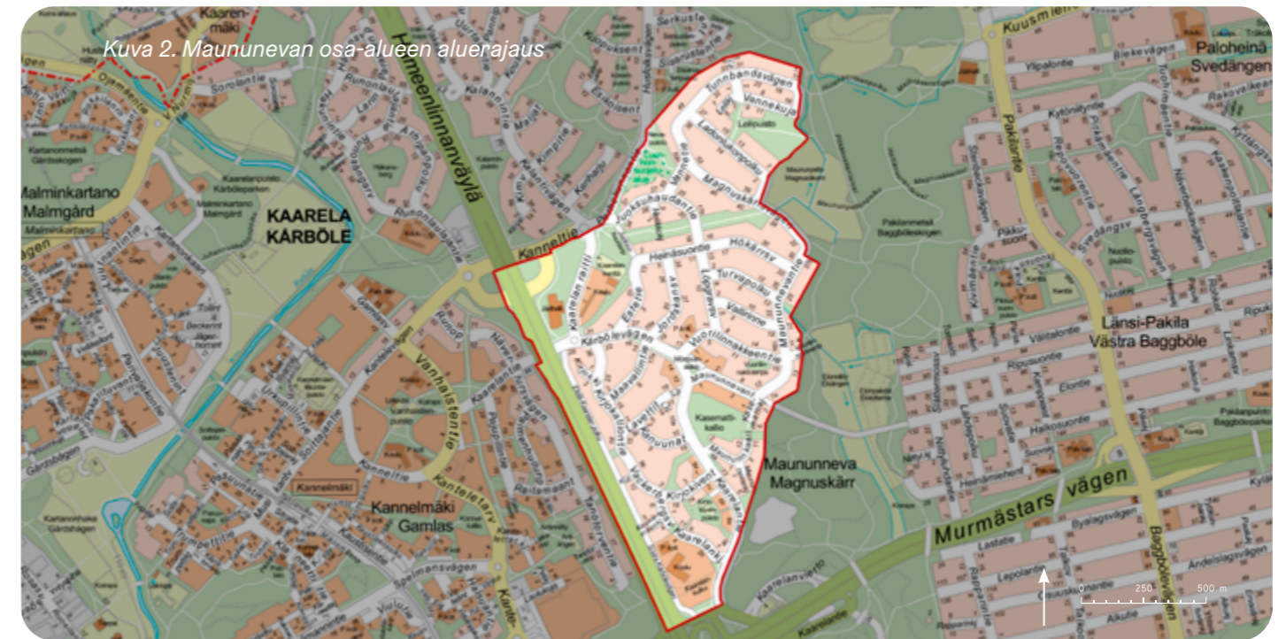
Kuva 2. Maununnevan osa-alueen aluerajaus