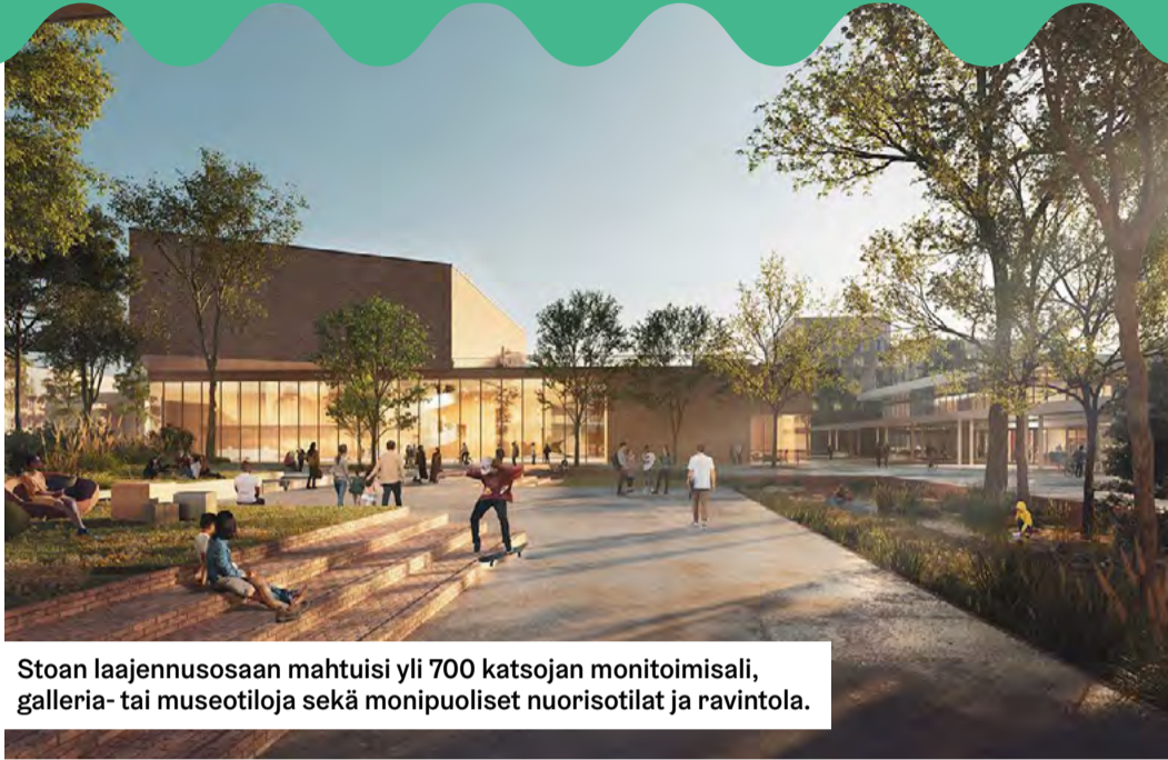
Stoan laajennusosaan mahtuisi yli 700 katsojan monitoimisaliksi, galleria- tai museotiloja sekä monipuoliset nuorisotilat ja ravintola.

Nuorten asiat ja Itä-Helsinki nousevat esiin podcastissa ”Itä kuuluu mitä kuuluu”. Podcast-sarjan ovat tuottaneet Nuorten toimintakeskus Kipinän Signaalimediassa toimivat nuoret yhdessä itäisen suurpiirin stadiluotsin Marjaana Jaranteen kanssa. Sarjan seuraava jakso julkaistaan kesäkuussa Spotifyssa ja loput jaksot syksyllä.