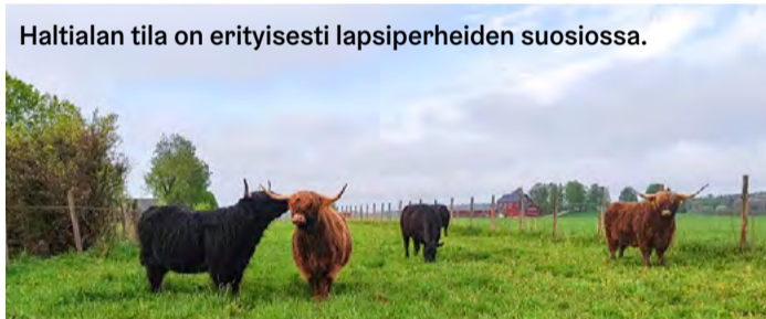
Haltialan tila on erityisesti lapsiperheiden suosiossa.