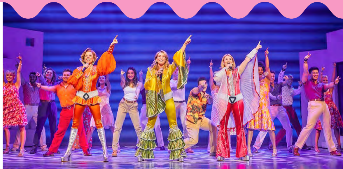
MAMMA MIA! UK & International Tour 2023 cast

Kulttuurikeskus Caisassa nähdään 15.6.–17.6. Hyeena-teatteri-esitys, jonka kuvataan raivaavan vähemmistölle tilaa ja mahdollisuutta olla olemassa, tulla nähtyksi ja ymmärretyksi.