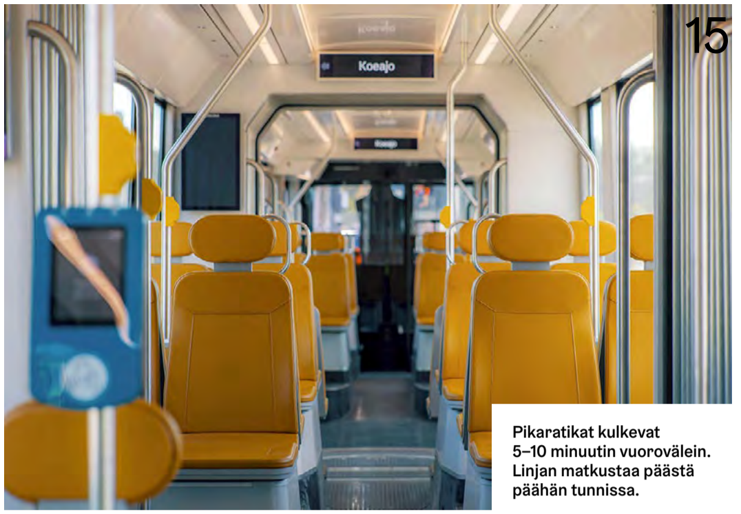
Pikaratikat kulkevat 5–10 minuutin vuorovälein. Linjan matkustaa päästä päähän tunnissa.