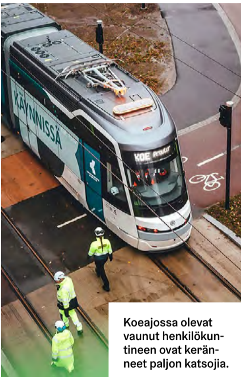
Koeajossa olevat vaunut henkilökuntineen ovat keränneet paljon katsojia.