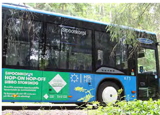
Hele Teutari/Vantaan kaupunki

Taksikuljetus Oy hoitaa liikennöintiä 1.10. saakka, yhteistyössä Sipoon kunnan sekä Vantaan ja Helsingin kaupunkien kanssa.