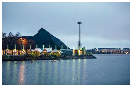
Hanasaari's pile of coal will soon disappear.

The most significant sources of direct emissions in Helsinki are heating, transport and electricity. Helsinki is promoting carbon neutrality with advances in energy efficient building technology, low-emission transport solutions, and renewable energy for heat and electricity production. Mayor Juhana Vartiainen wants Helsinki to take bold steps and be a forerunner in ecological sustainability on both a national and global level. The city has also