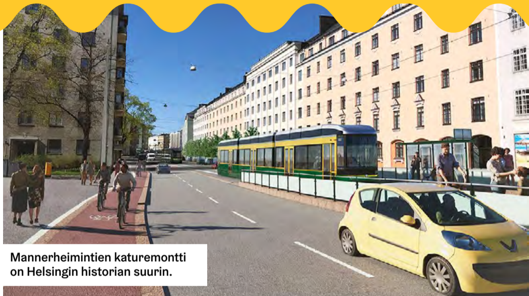
Mannerheimintien katuremontti on Helsingin historian suurin.

Palvelukartta on saanut uuden käyttöä helpottavan ilmeen. Palvelun osoite on palvelukartta.hel.fi . Kartalta löytyvät esimerkiksi julkisen liikenteen pysäkit, leikkipuisot, pysäköintialueet ja terveysasemat esteettömyystieteen. Kartta on suomeksi, ruotsiksi ja englanniksi.