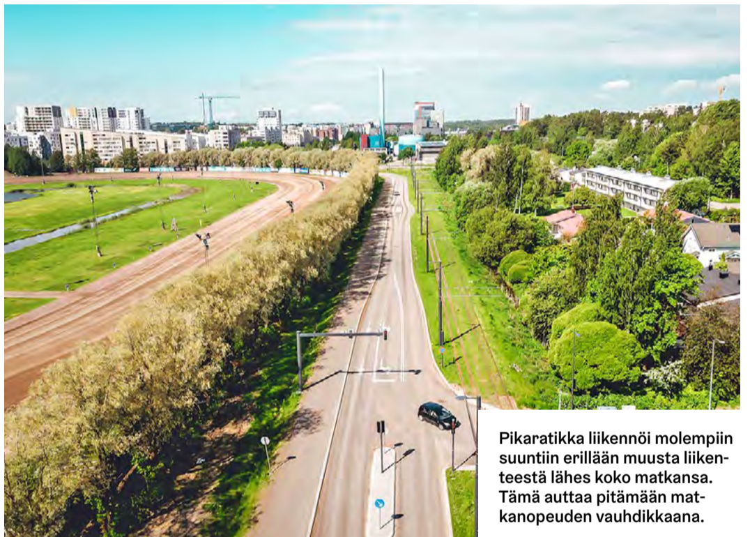
Pikaratikka liikennöi molempiin suuntiin erillään muusta liikenteestä lähes koko matkansa. Tämä auttaa pitämään matkanopeuden vauhdikkaana.

Pikaratikka korvaa Helsingin vilkkaimman bussilinjan 550, jolla ei kyetä hoitamaan tulevien vuosien voimistuvaa matkustajavirtaa. Pikaratikka pystyy jopa kolminkertaistamaan matkustajamäärät. Eivätkä ne nykyiselläänkään pieniä ole – bussilinja 550 poimii kyytiinsä arkipäivisin 40 000 matkustajaa. Vuonna 2030 matkustajia arvioidaan olevan jo 91 000 ja vuonna 2050 peräti 125 000.