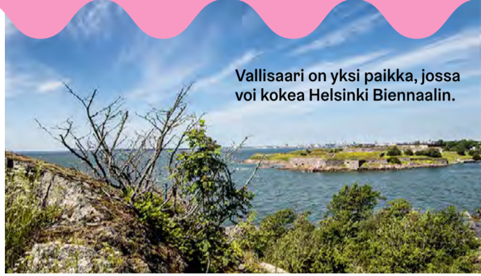
Vallisaari on yksi paikka, jossa voi kokea Helsinki Biennaalin.