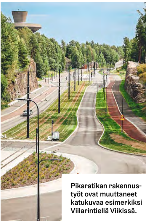
Pikaratikan rakennustyöt ovat muuttaneet katukuvaa esimerkiksi Viilarintiellä Viikissä.