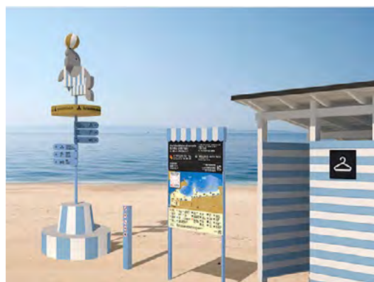
Havainnekuva: Muotoilutoimisto Kuudes

Kaupunki haluaa selkiyttää ja ajantasaistaa uimarantojensa opasteita. Uusiin opasteisiin tulee tietoa esimerkiksi uimarannan palveluista ja säännöistä sekä ohjeet hätätilanteita varten. Kaupungilla on 12 valvottua ja 12 valvomatonta uimarantaa, ja opasteita on tulossa niistä kaikille.