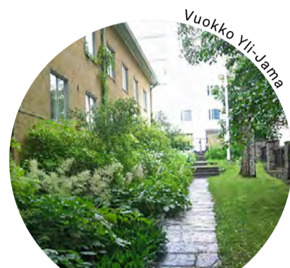
Vehreä piha Etu-Töölössä