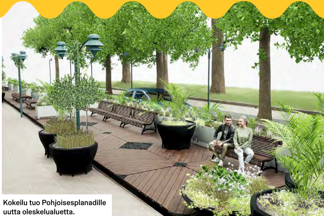
Kokeilu tuo Pohjoisesplanadille uutta oleskelualueutta.

Helsinki oli kolmas kaupunkien yhdenveroisuutta ja tasa-arvoa mittaavassa Euroopan komission "European Capitals of Inclusion and Diversity 2023" -kilpailussa. Helsinkiä kiitettiin tasa-arvon ja sateenkaariväen osallisuuden edistämisestä, henkilöstön antirasistisista koulutuksista ja esimerkiksi Digiystävähankkeesta, joka paransi ikääntyneiden digitaitoja. Vahvojen rakenteiden ja linjausten ansiosta Helsingistä on tullut yksi tasa-arvon ja yhdenvertaisuuden edistämisen kärkikaupungeista EU:ssa. Yli 50 000 asukkaan kaupunkien luokassa oli 40 osallistujaa. Voitto meni Espanjan Terrassaan ja toiseksi sijoittui Bryssel.