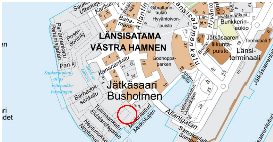
Kuva: Helsingin kaupunkiympäristö, Sijaintikartta. Ei mittakaavassa.

Helsingin kaupunki myy avoimella tarjouskilpailulla Jätkäsaarella sijaitsevat tontit (AK) 20084/1 ja (A) 20084/2–7. Tonttien varaamisesta tarjouskilpailuun, jossa tontit myydään, on päättänyt kaupunginhallitus 10.1.2021 (14 §).