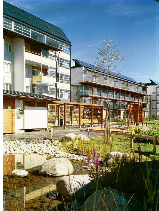
Eko-Viikissä hulevesiä on piholla hyödynnetty jo lähes kaksikymmentä vuotta. Tilanhoitajankaari 22 heti valmistumisen jälkeen.

Mikäli kiinteistön hulevesien imeyttäminen tontilla ei onnistu ja vesien johtaminen vesihuoltolaitoksen hulevesiviemäriin muodostuisi vesihuoltolain määrittämällä tavalla kohtuuttomaksi tai muulla tavoin erityisen vaikeaksi, on kiinteistön johdettava tontin hulevedet kunnan hulevesijärjestelmään. Tämä velvoite sisältyy maankäyttö- ja rakennuslakiin . Vapautusta liittymisestä kunnan hulevesijärjestelmään haetaan 1.6.2017 alkaen Helsingin kaupunkiympäristölautakunnan ympäristö- ja lupajaos-