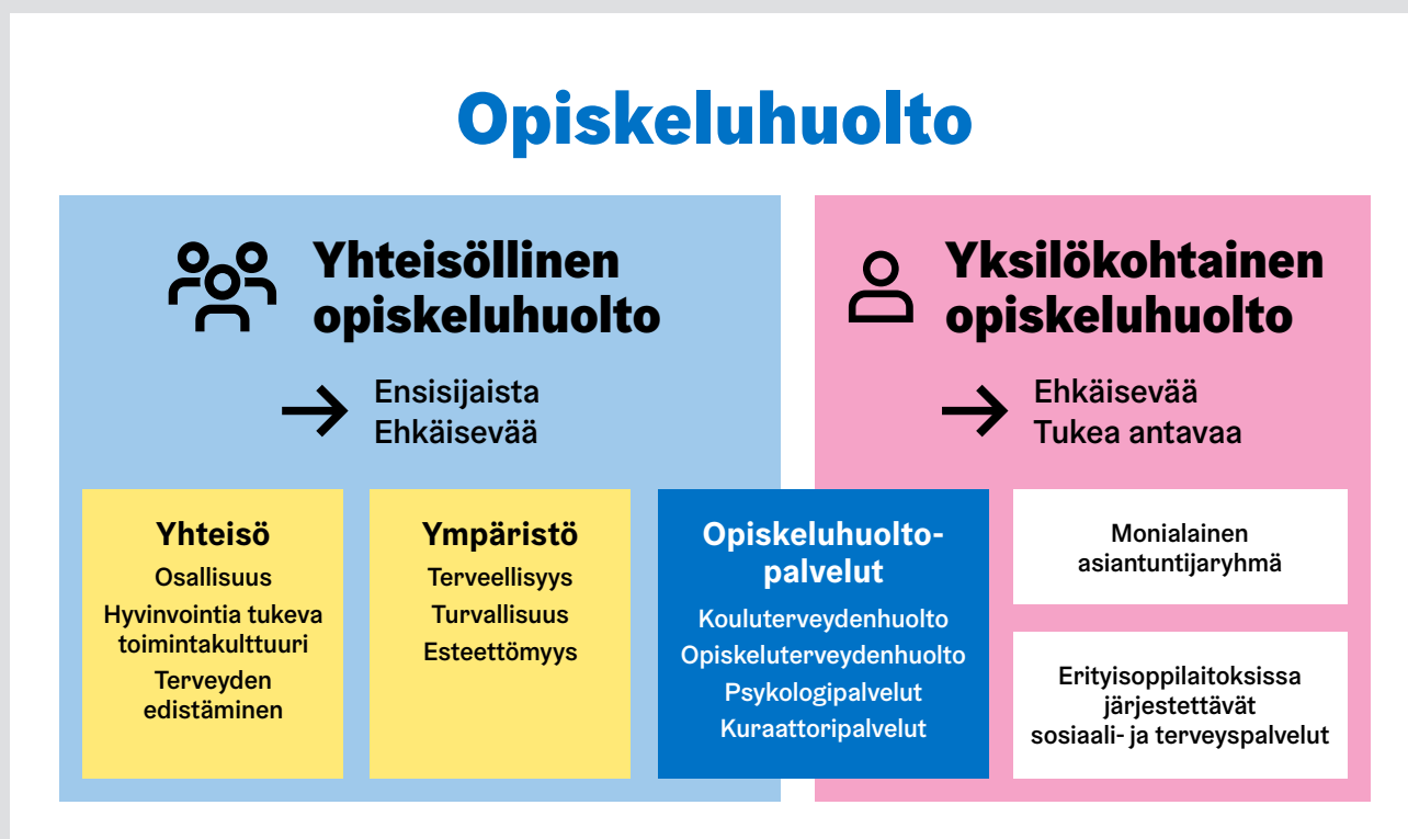
Kuvio 1. Opiskeluhoollon kokonaisuus.

ja heidän huoltajiensa sekä tarvittaessa muiden yhteistyötahojen kanssa. Lisäksi oppijoilla on oikeus yksilökohtaisiin opiskeluhohtopalveluihin, joita ovat esiopetuksen neuvolapalvelut, koulu- ja opiskeluterveydenhuolto sekä kuraattori- ja psykologipalvelut.