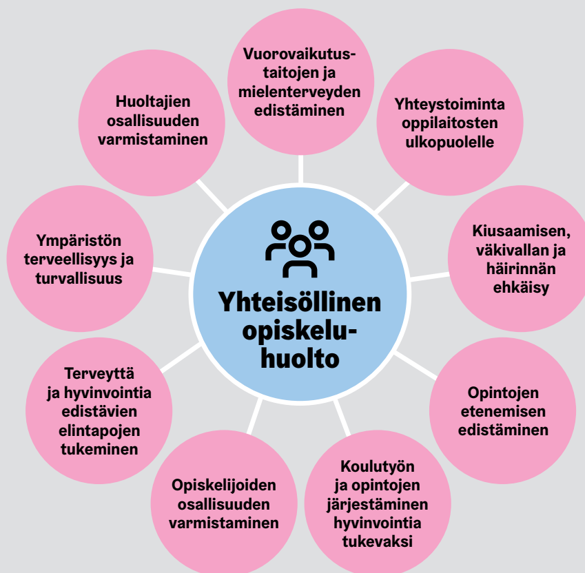
Kuvio 3. Esimerkki yhteisöllisen opiskeluhoollon toiminnan sisällöistä. (Lähde: THL)

Hyvinvointia tukeva yhteisöllinen opiskeluhoolto kohdistuu koko oppimisyhteisöön, mutta työtä voidaan myös kohdentaa tietyille luokka-asteille tai ryhmille, esimerkiksi esiopetuksen tai koulun aloittamis- tai päätösvaiheeseen tai tunnistetun ryhmään liittyvän ongelman perusteella. Kuviossa 3 on esiteltyä esimerkin omaisesti yhteisöllisen opiskeluhoollon toimintasisältöjä.