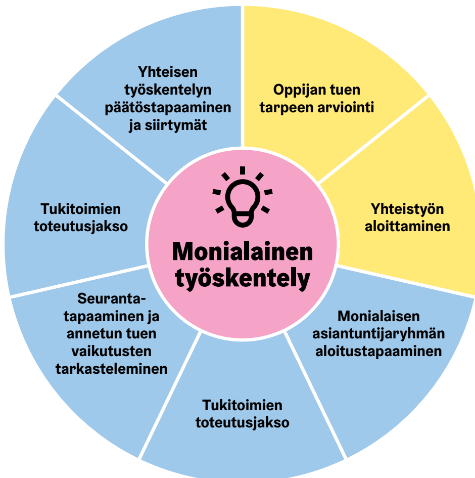
Kuvio 4. Yksilökohtaisen opiskeluhoollon monialaisen työskentelyn prosessikuvaus.

(Monialaisen työskentelyn prosessikuvaus)