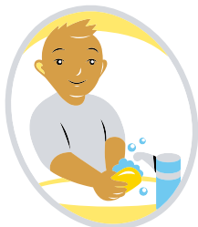
Enese eest hoolitsemin ja argioskused