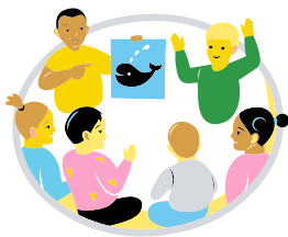
Osalus ja mõjutamine