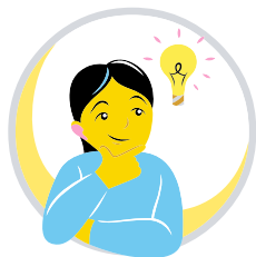
Mõtlemine ja õppimine