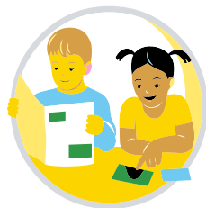
Mitmikirjaoskus ja IKT-oskused