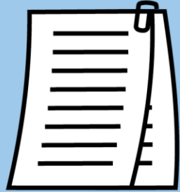
Taustatiedot ja liitteet