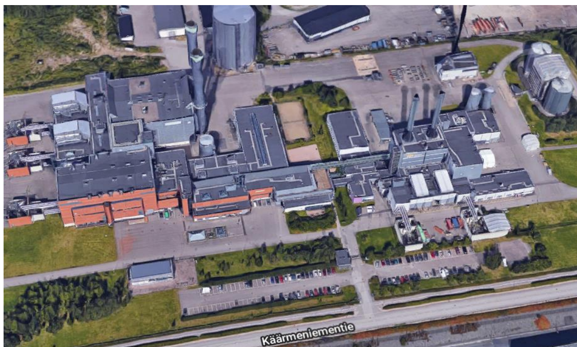
Kuva 1. Vuosaaren voimalaitoksen A- ja B-voimalaitokset.

Helen Oy:n Vuosaaren voimalaitoksella tuotetaan sähköä ja kaukolämpöä. Voimalaitoskokonaisuuteen kuuluvat A- ja B-voimalaitokset apulaitoksineen sekä maanalainen öljyluola. Edellä mainittujen laitosten sijainnit on esitetty kuvassa 1.