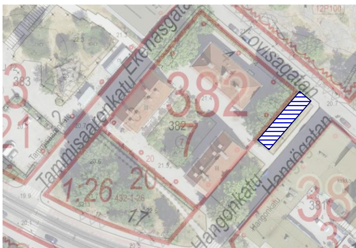
Kuva 2 Maantasoon mahdollisesti sijoitettavien autopaikkojen likimääräinen sijainti (rasteroitu alue)

Autopaikkoja saa myös esittää sijoitettavaksi uudisrakennukseen sijoitettavaan katutasoisen autotalliin. Tällöin edellytetään kaupunkikuvallisesti ja viherrakentamisen osalta erityisen korkeatasoista esitystä.