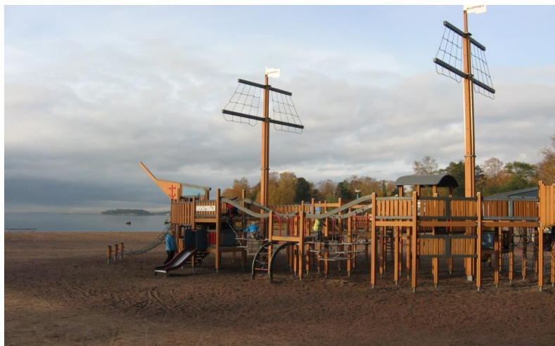
Lekredskap för barn på Drumsö strand