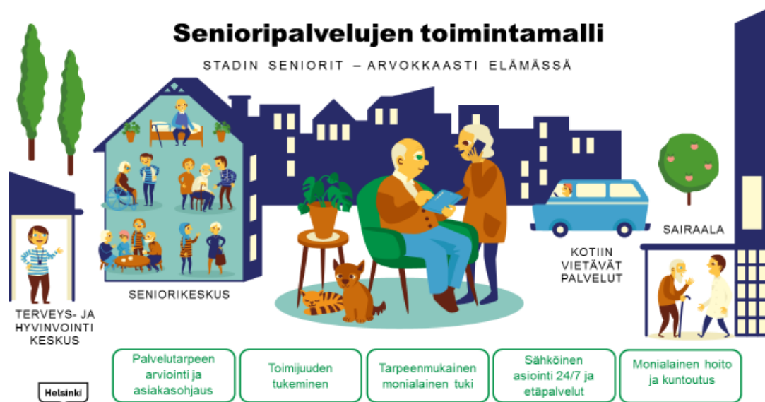
Kuva 1. Senioripalvelujen toimintamalli Helsingissä.

Helsingin kaupungin kotihoidon visio Stadin kotihoito –kunnan hoitoa kotona. Palvelulupaus määriteltiin osana kotihoidon kehittämissuunnitelmaa 2019-2021. Kotihoidon palvelujen lähtökohtana on asiakkaiden omien voimavarojen tukeminen ja kuntouttava työote. Kotihoito tukee ja vahvistaa asiakasta auttamalla ja ohjaamalla niissä toimissa, joihin hän ei itse pysty tai joihin hän ei saa apua esimerkiksi omaisiltaan tai läheisiltään.