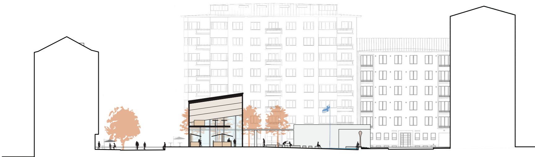
Leikkaus A-A 1:500 Torin poikki Töölöntorinkadulle päin