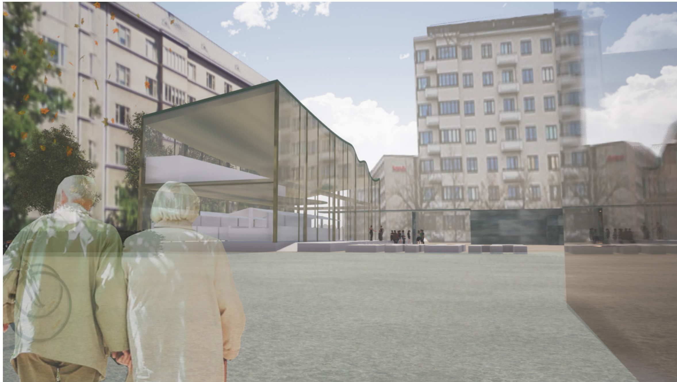
Näkymä torin länsipäädystä kohti paviljonkia.