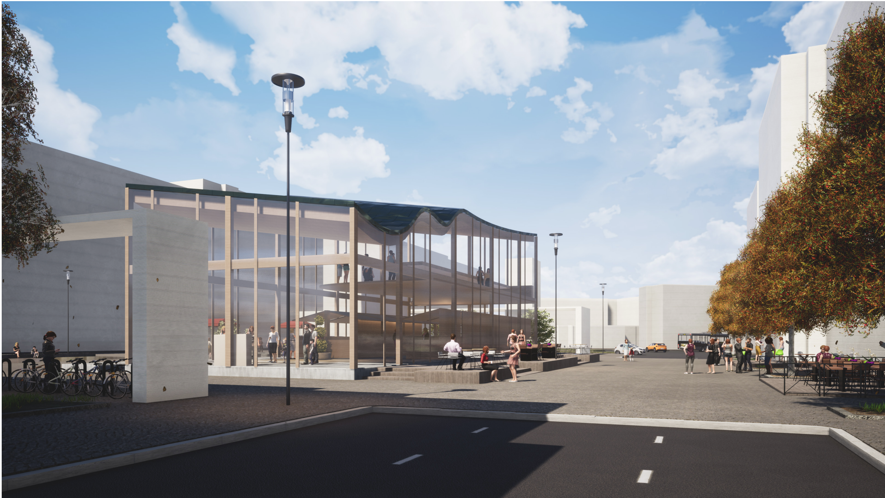
Näkymä terassikadulle Töölöntorinkadun ja Tykistönkadun kulmasta.