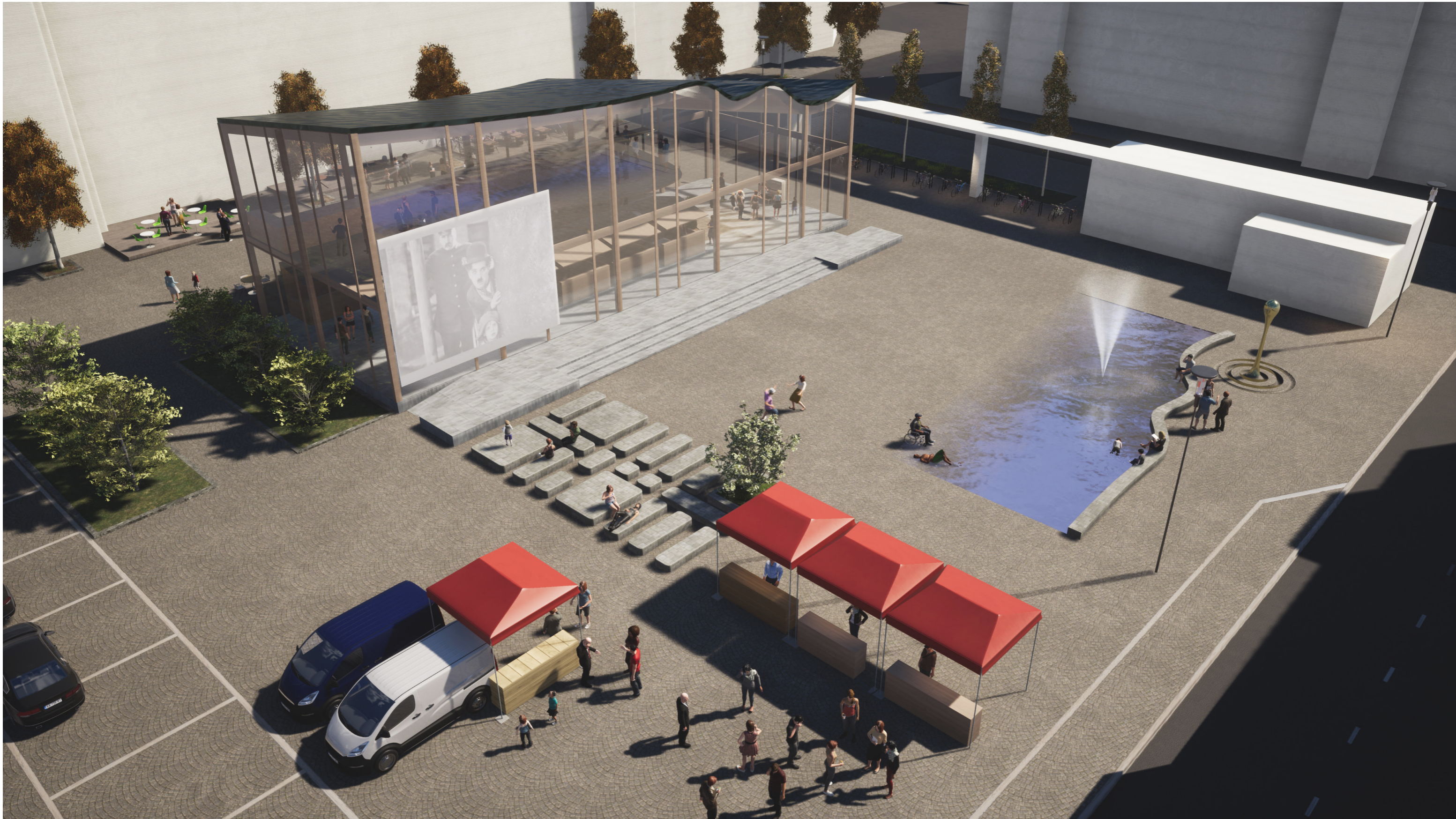
Näkymä Töölöntorille lounaasta.