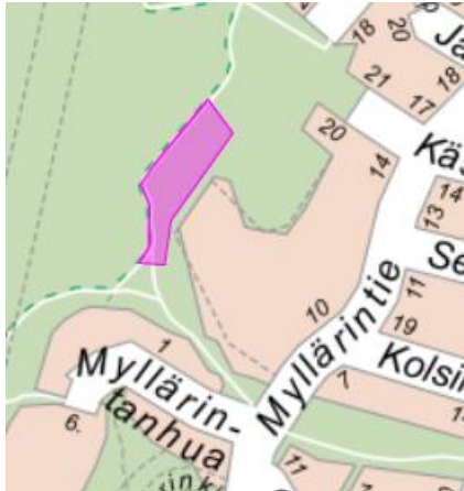
Bild 1 Kartutdrag från planeringsområdet