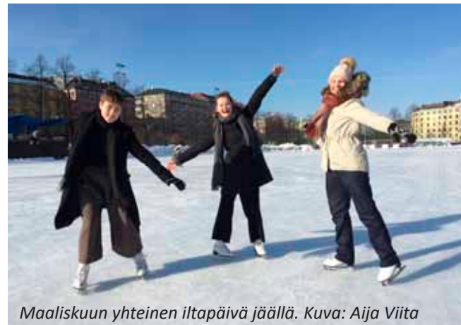
Maaliskuun yhteinen iltapäivä jäällä.

Syyskuun alussa tutorit järjestivät Meriharjun ryhmäytymispäivän ohjelman ryhmänohjaajien kanssa. Kakkosjaksossa tutoreilla oli ryhmien omia "kettu-tapaamisia" ja myös koko ykkösvoosikurssin yhteinen "kettu-tapaaminen". Joulukuussa järjestettiin vielä ykkösten pikkujoulu yläläisillä. Tutorit ovat osallistuneet myös avoimiin oviin marras- ja joulukuussa kertomalla Kallion lukioon hakemisesta ja lukio-opiskelusta. Osa tutoreista kävi myös lukuvuoden aikana esittelemässä yläkouluilaisille Kallion lukiota.