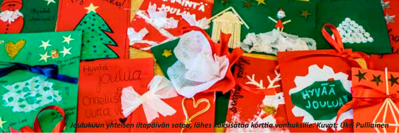
Joulukuun yhteisen iltapäivän satoa, lähes kaksisataa korttia vanhuksille.