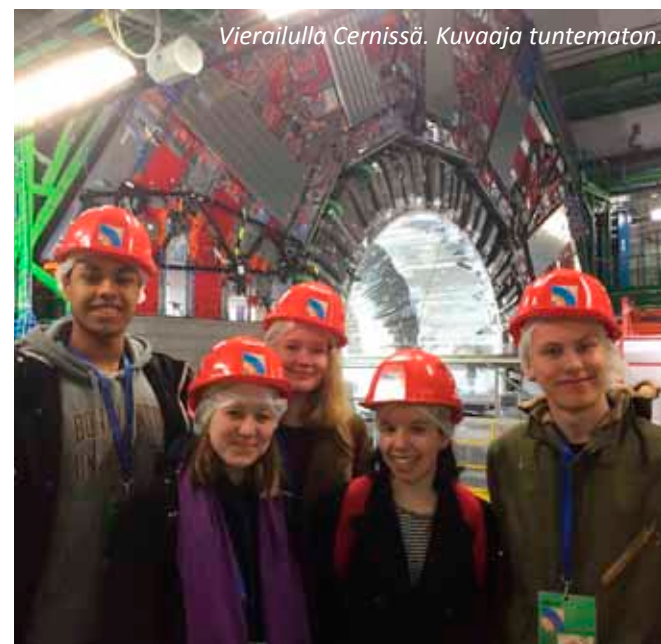
Vierailulla Cernissä.

Teksti on äidinkielen ja kirjallisuuden sekä historian kurssien yhteistyön satoa.