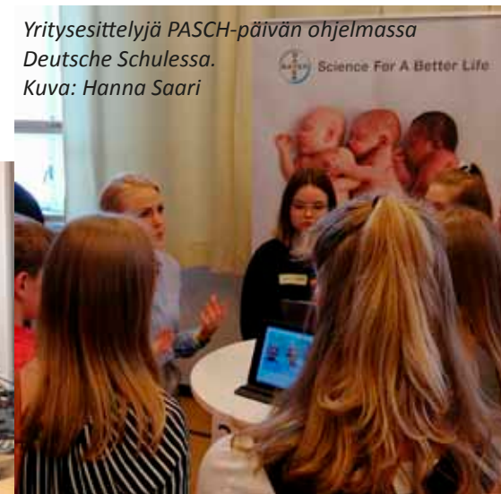
Yritysesittelyjä PASCH-päivän ohjelmassa Deutsche Schulessa.