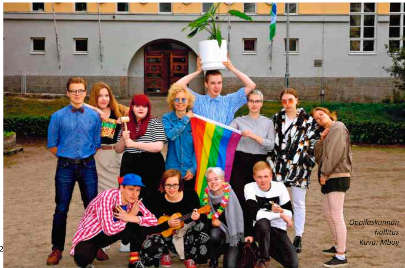
Oppilaskunnan hallitus