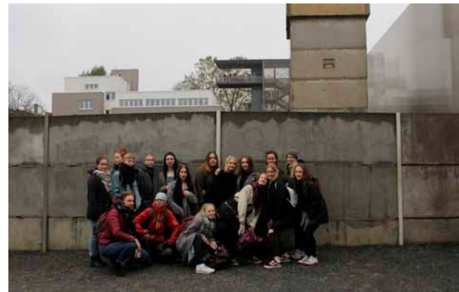
Teatteriproggis Game of Walls Berliinissä inspiraatiota etsimässä. 'Hyvää matkaa. Ja turvallista matkaa. Gute reise! Viel Spass!'