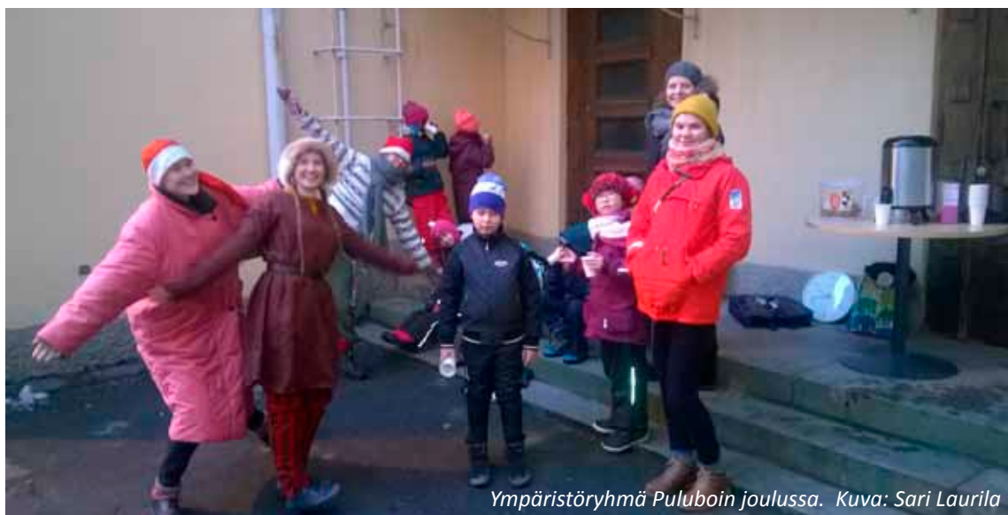
Ympäristöryhmä Puluboin joulussa.