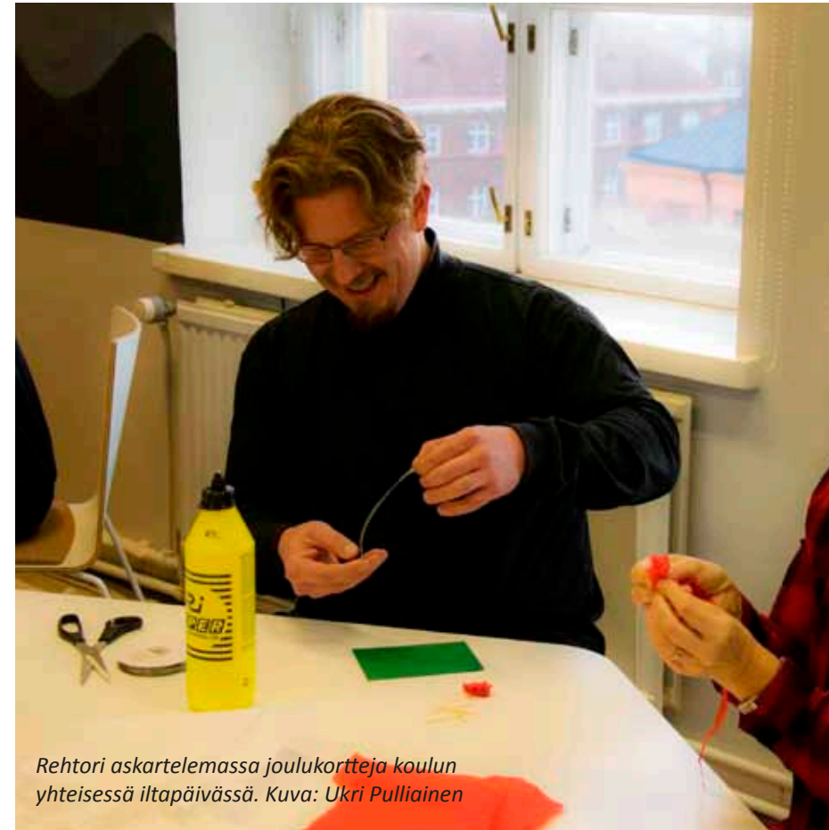
Rehtori askartelemassa joulukortteja koulun yhteisessä iltapäivässä.

Uudistukset etenevät monella muullakin rintamalla kuin vain digitalisaatiossa. Olemme olleet tänä lukuvuonna pilottilukiona Liikkuva koulu -hankkeessa ja pyrkineet kehittämään käytänteitä, joilla lukiolaisten arkeen saataisiin vaivattomasti lisää liikuntaa. Ensi lukuvuonna tämä näkyy paremmin myös opiskelijoiden arjessa. Olemme mukana myös Hundred-hankkeessa, jossa kerätään Suomesta ja maailmalta 100 opetusalan innovaatiota kaikkien käyttöön. Olemme ensin mukana kehittämässä yliopistoyhteistyömallia yhdessä Helsingin muiden lukiodien ja Helsingin yliopiston kanssa. Nuorten työelämä- ja uratietoisuutta pyrimme parantamaan aloittamalla ensi lukuvuonna alumni-toiminnan. Tekemistä siis riittää jatkossakin. Tämän varmistaa viimeistään se, että uusi lukiolaki ja uusi laki ylioppilastutkinnosta astuu voimaan 2019. Siitä seuraa, että meillä on uusi opetussuunnitelma jälleen vuonna 2021.