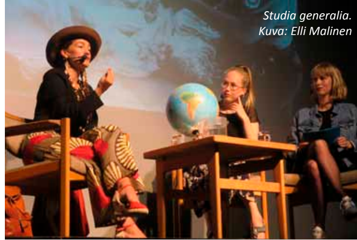
Studia generalia.